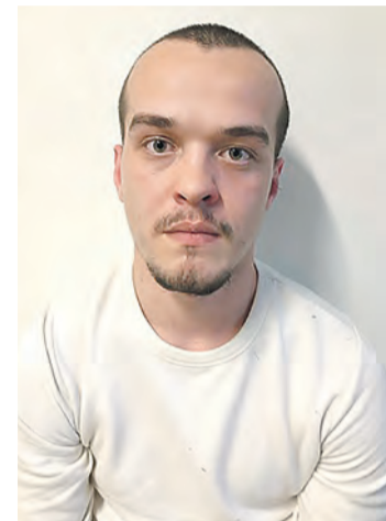
Kelmide tabatud rahakuller.

ga seotud juhtumite ja kannatanute arv, võimaliku kahju suurus ja tema roll pettuskeemis.