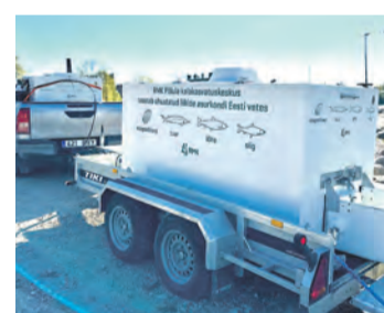
Kalamaimude vedamise haagis.

Hiiumaa meresiiuga sobib teadlaste hinnangul kasutada asusta-