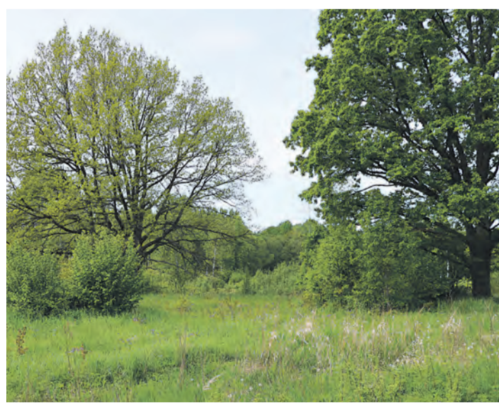
Keskonnaamet loodab jõuda Turvalepa looduskaitseala moodustamiseni järgmisel aastal.