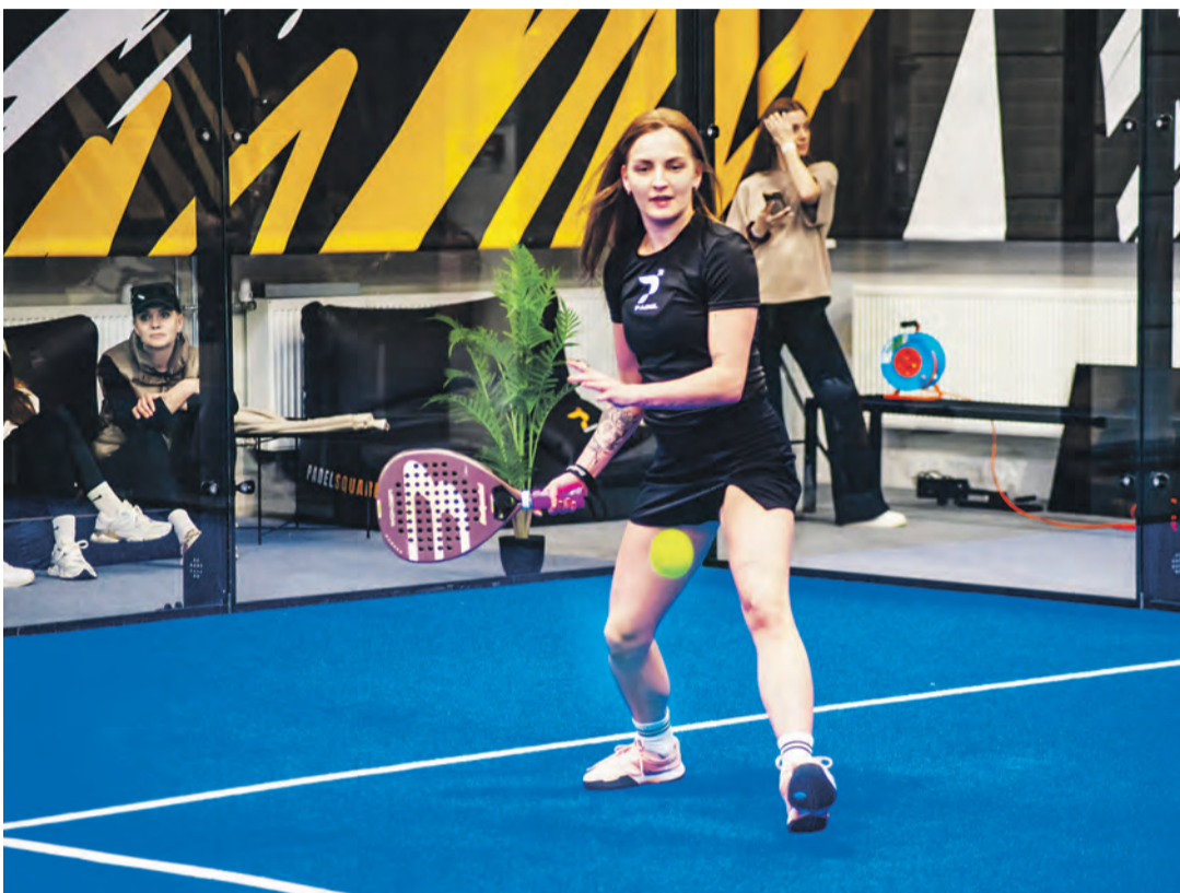
Kõik huvilised said avapäeval padelimängu proovida.