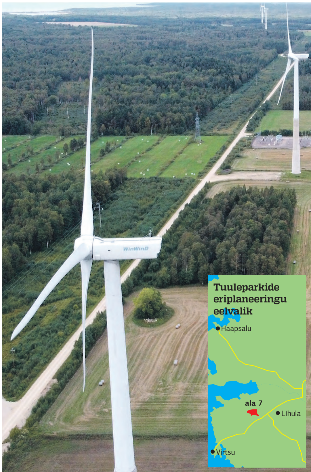
Tuuleparkide rajamisel kipub kõige rohkem aega kuluma sobiva asukoha leidmisele. URMAS LAURI

Mõlemas dokumendis on huvitatud isikuks märgitud OÜ Irbeni, mis kuulub äriregistri andmetel täielikult osahingule Uti-