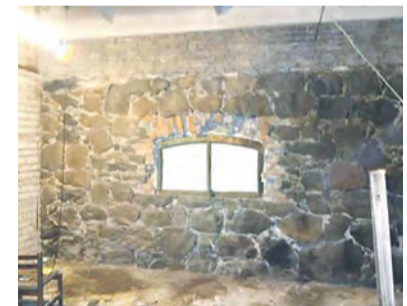
Arvatav viinavabriku müür.

ta teist ja mõlemad, nii uus kauplus kui ka senine ajalugu, saavad kõrvuti eksisteerida. Oleme seda ise praktikas kasutanud. Kohalike inimeste kaasamine aruteluks on igati asjakohane just enne otsuste tegemist.