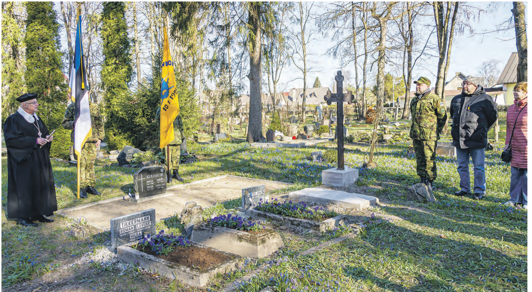
Hiiumaa muinsuskaitse selts tegi oma kulu ja kirjadega korda kahe Vabadussõjas osalenud hiidlase hauad Haapsalu vanal kalmistul.