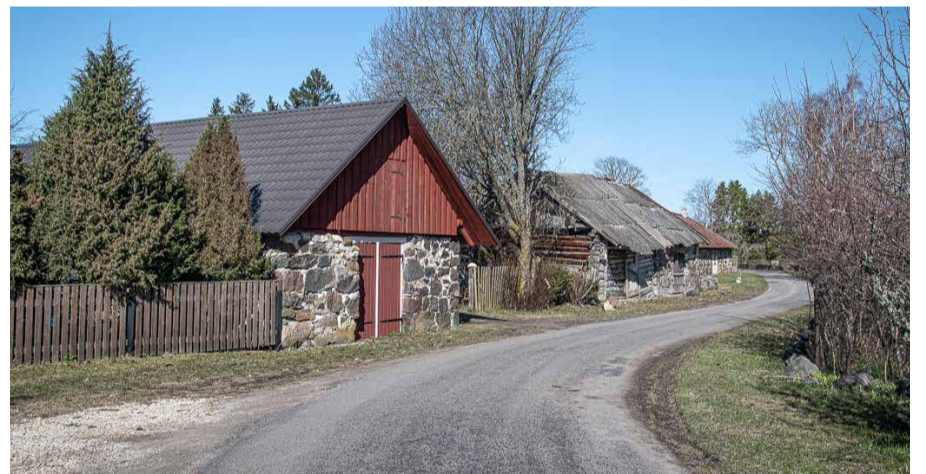
Hoitud ja vanad hooned räägivad oma lugu ilmekal teelõigul Dibys.

Kui arhitektuuripärandi puhul saame rääkida peamiselt 1920.-30. aastate stiilist (mõni üksik näide ka