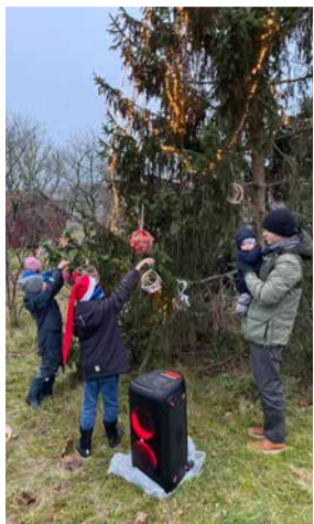
1. detsembril süüdati Hullos kuusel jõulutuled.