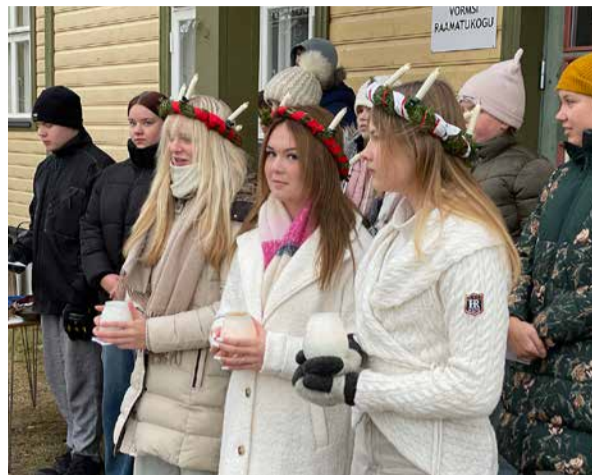
13. detsembril jagasid Luciad kooli ees valgust.