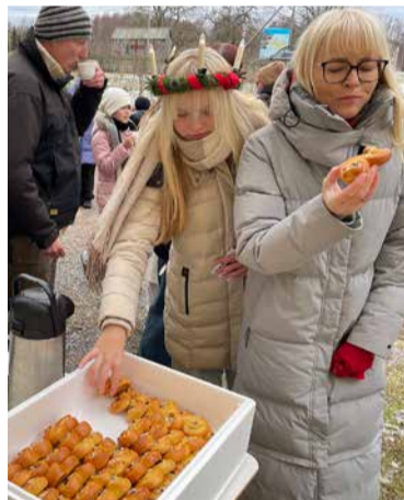
Luutsinapäeval sai maitsta lussekatter'it ehk safranisaiaikest.