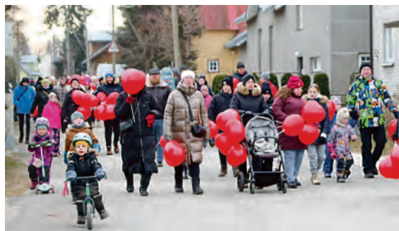
HAAPSALU NOORTE HUVIKESKUS