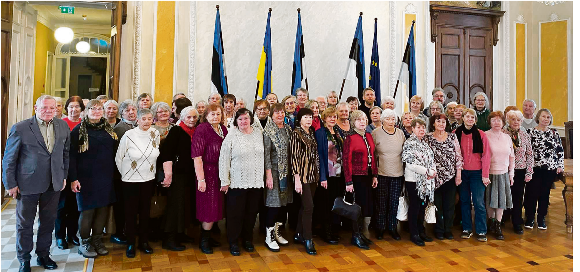
Läänemaa pensionäride ühenduse liikmed külaskäigul riigikokku.