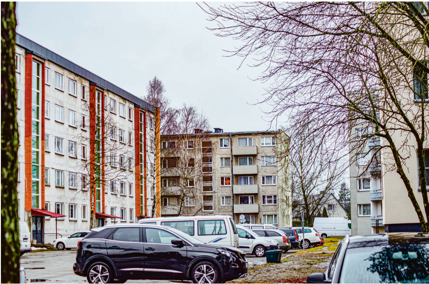
Maaklerite hinnangul ei tule 10–20 aasta lõikes vana korteri ostmise uue korteri ostust soodsam.