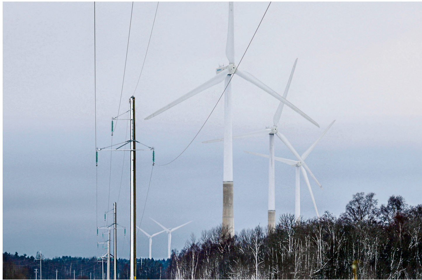
Osühing RNW Wind näeb Erja ja Vätse külas tuuleenergia tootmiseks potentsiaali.

Rammu sõnul küsis ta arendajalt, kui palju oleks neid kompensatsiooni saavaid majapidamisi, mis asuksid tuuli-