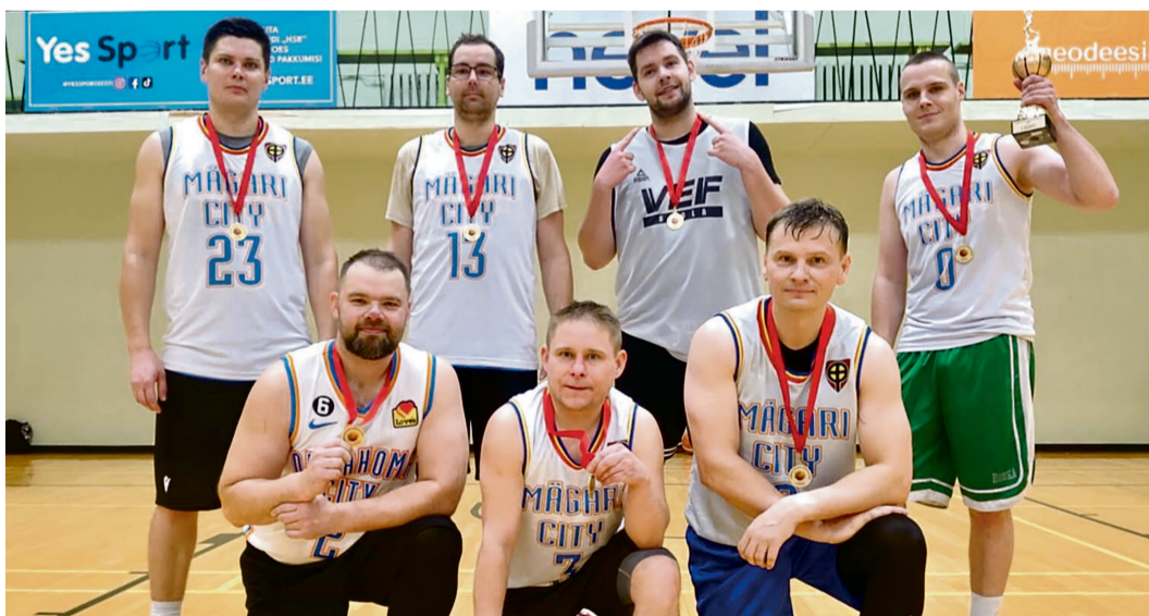
Rahvaliiga meister Mägari võistkond.

Teises poolfinaalis sai Mägari väga hästi kaitses hakkama Pü-