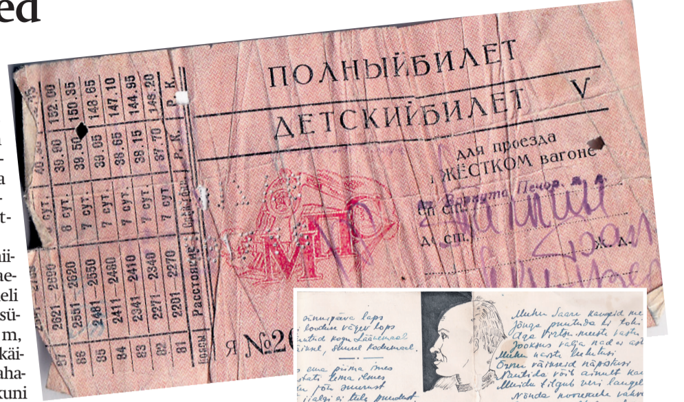
Pilet vabadusse. Rongipilet Vorkuta - Tallinn. 7. mai, 1956.

See oli hii-gelsuur kaevandus – neli horisonti, sügavus 416 m, kaevanduskäike koos maha-jäetutega kuni 700 km. Mehi töötas 14 jaoskonnas kolmes vahetuses 1800 ringis.