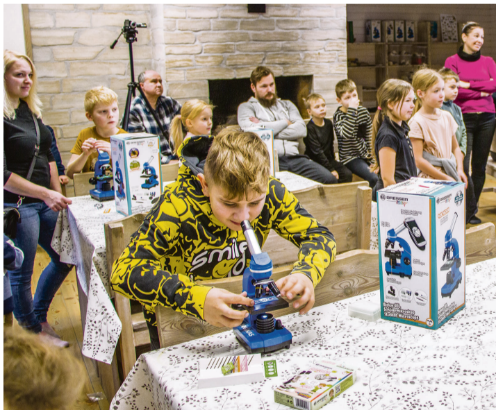
Mikroskoobiga sai uurida putukaid.