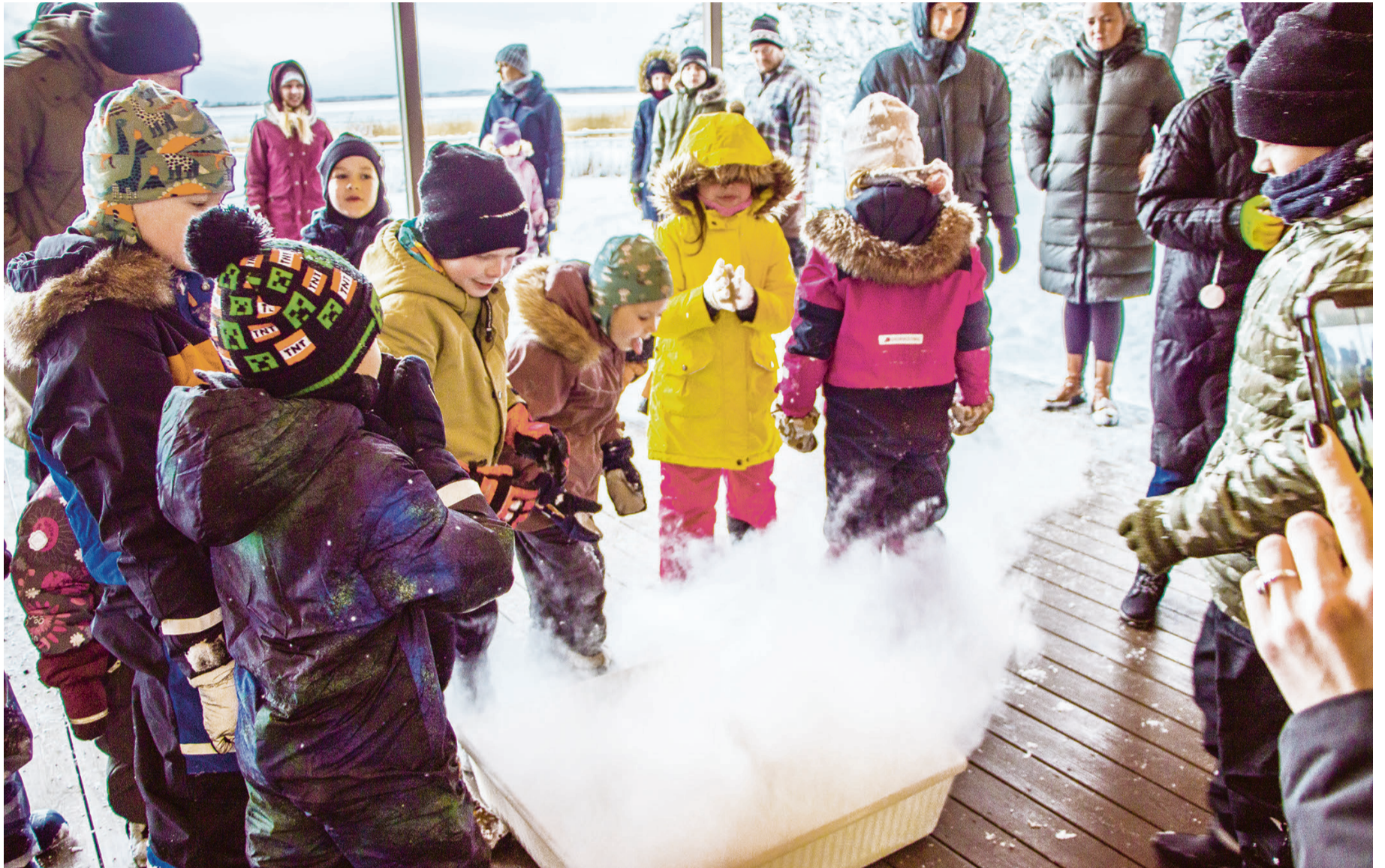
Lapsed jälgivad kuiva jääga suitsu tegemist.

Enne Silma õpikoja ametlikku avamist on Innokas seal kor-