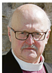
TIIT SALUMÄE emeritpiiskop

Vabadussõja hind Eestile oli purustatud hooned, 5000 langenut, 14 000 haavatut, kellest 2600 jäi invaliidiks.