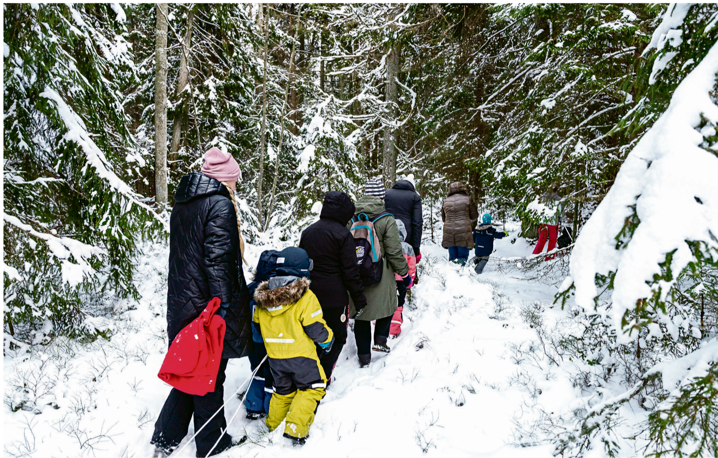
Läänemaa koolidele tegi keskkonnaamet sel aastal kümme programmi, kus osales tublisti üle saja lapse.