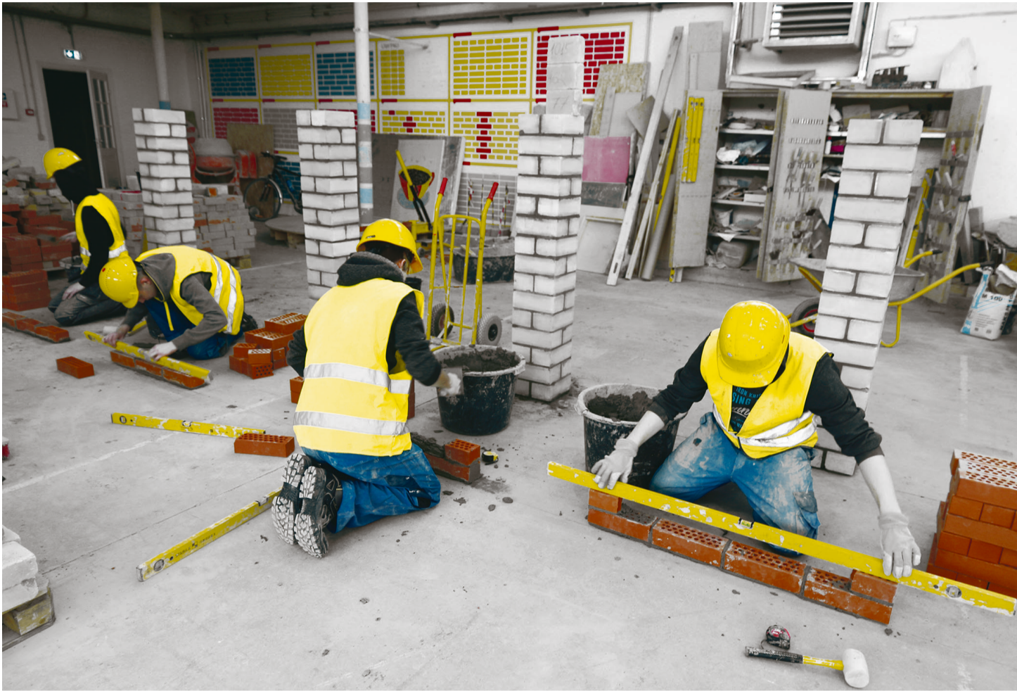
Õppimiskohustuse ees tõstmisega suureneb kindlasti kutsekoolide roll.