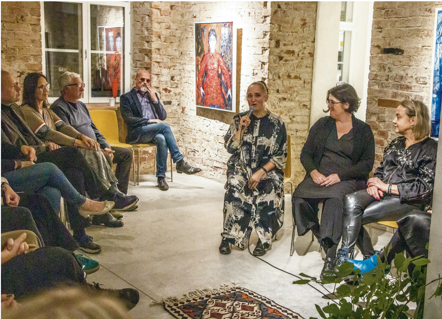
Esimesel „Õhtul Okases” tutvustasid muuseumi loojad ennast ja oma plaane.

Praegu on Okase muuseumi esimese korruse näitusesaalis vaadata väike perekondlik näitus, kus on väljas Okase tüt-