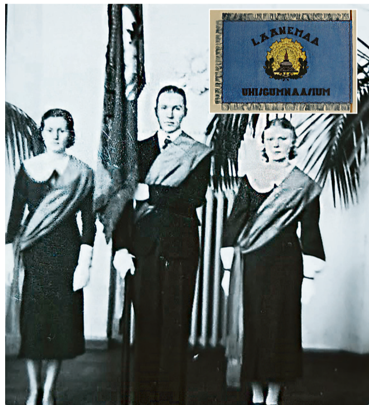
Lipu kandmine oli au ja lippuriteks valiti parimad õpilased. 1938 kandsid lippurid koolivormi, valgeid kindaid ja siniseid õlalinte.

vembril 1941 Haapsalu gümnaasiumi õppenõukogu protokollist leiame lause: „Otsustati aktusele tuua kooli lipp, mis on hoitud mõõdund aastal kommunistide kätte sattumast.” Kahjuks ei tea me kogu lugu. Kas punasel aastal üritati kooli lippu füüsiliselt hävitada? Kes olid need, kes aitasid koolilippu varjata?