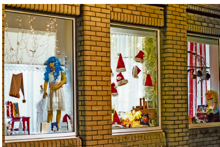
Haapsalu pitsikeskuse iga aken jutustab ühe muinasloo.

Käsitööselti liikmed valisid sealt loo ja kujundasid muinasjutuaknad. „Kui naised küsisid, kuidas teha, siis andsin nõu, et markeerige. Tervet lugu ju aknale panna ei saa,” ütles Sims.