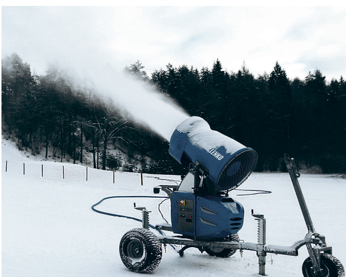
Pikajalamäe lumekahurid ootavad külma, et saaks hakata lund tootma.

Tänavuse suusahooaja üheks pärliks on Pikajalamäel, et valmimas on suusaraja valgustuse teine, 25 valgustiga 1,5 km pikkune lõik. 1,5 km pikkune lõik valmis 2010. aastal, nüüd vaheta-