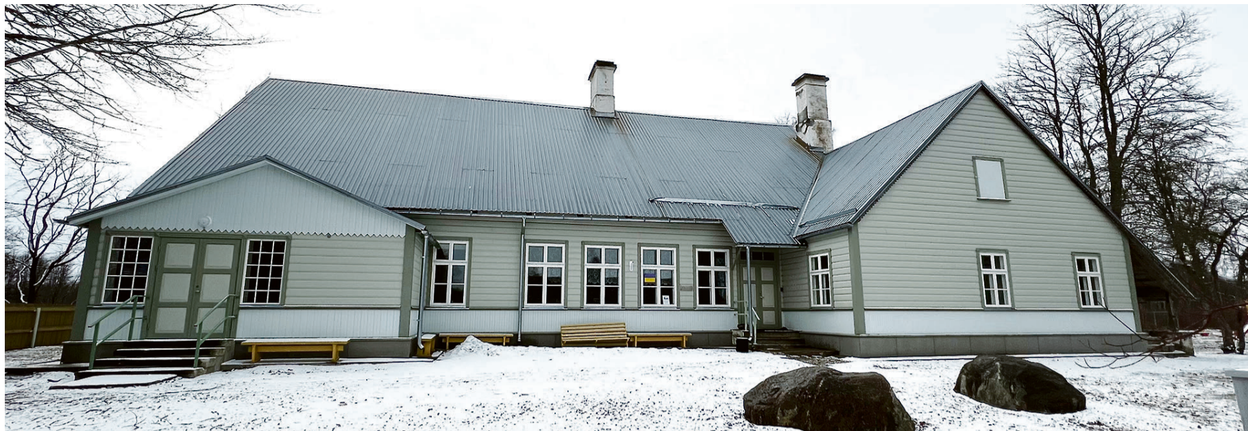
Ligi paarkümmend aastat tagasi loodud Asuküla selts tegutseb Asuküla kunagises koolimajas.