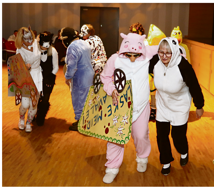
Oru kultuurisaalis astus üles kõikvõimalikke kostümeeritud tegelasi.

„Kui Oru Jommid tulid ja ütlesid, et kutsuks vallahava kokku,