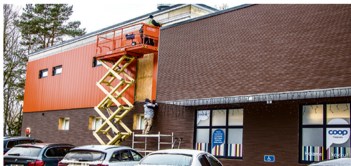
Taebla Coop'i kauplus.