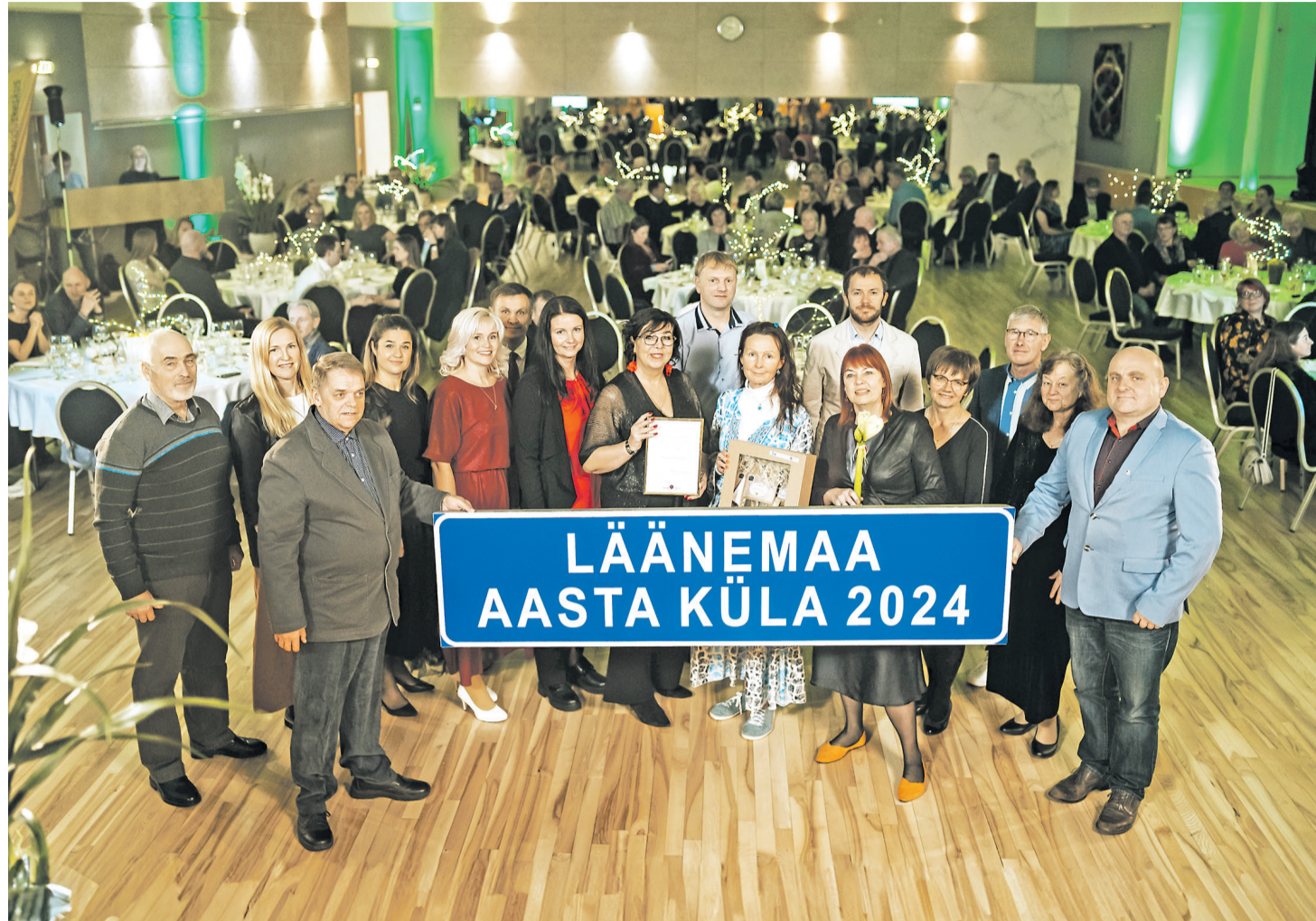
Läänemaa aasta küla siit läks Oru kanti.