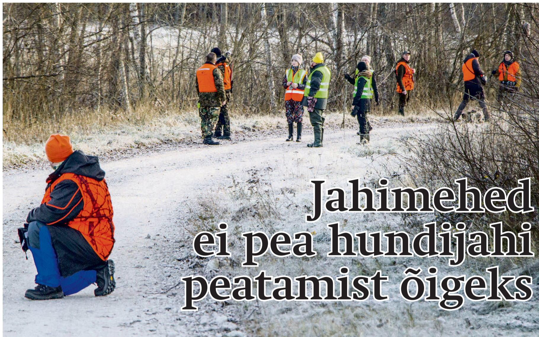
Läinud talvel korraldati Vormsil võsaviillemite tabamiseks mitu ühisjahti.