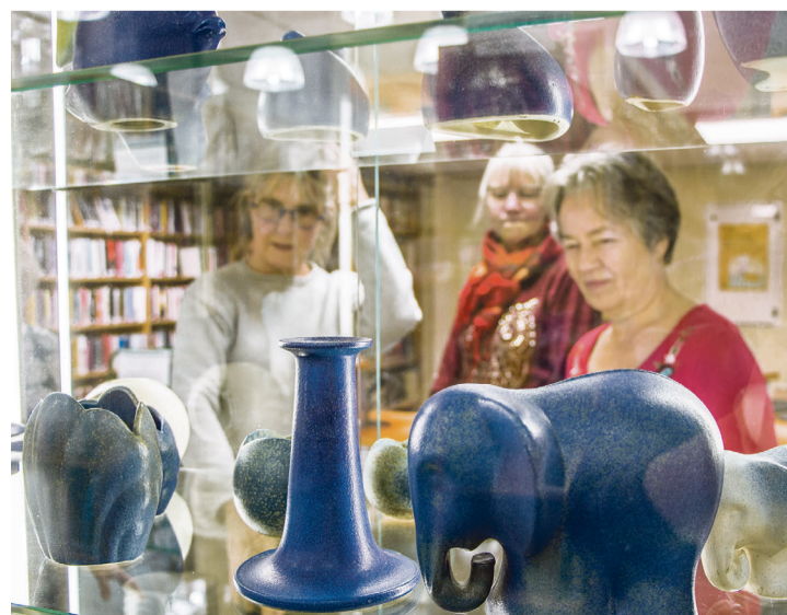
ARSi keraamika jõudis raamatukokku kahe kollektsionääri kogust.

Tõnisma vanim ARSi vaas on pärit 1960. aastatest. Sellest vaa-