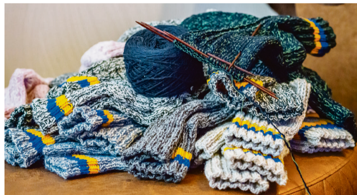
Ukraina värvides sokid sõduritele.

2024. aasta veebruaris läks Haapsalust Tallinnasse ja sealt edasi Ukrainasse kuus pappkasti: 155 paari villaseid sokke ja kin-