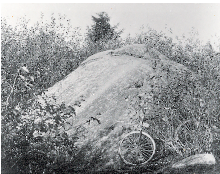
Kokuta Liukivi 1920. aastatel.

Ehk aga tasuks pöörata pilk minevikus kasutatud abinõude poole. Ajaloos on ju olnud perioode, kus järeltulijate järele on olnud lausa karjuv vajadus. See tekkis siis, kui inimkonna areng