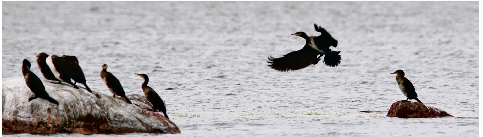
Kormorane näeb sageli meres kividel konutamas.

Kuni 1990. aastateni oli kormoran Eestis haruldane lind. Valkeri sõnul ei tähenda see, et kormoran oleks uustulnukana Ees-