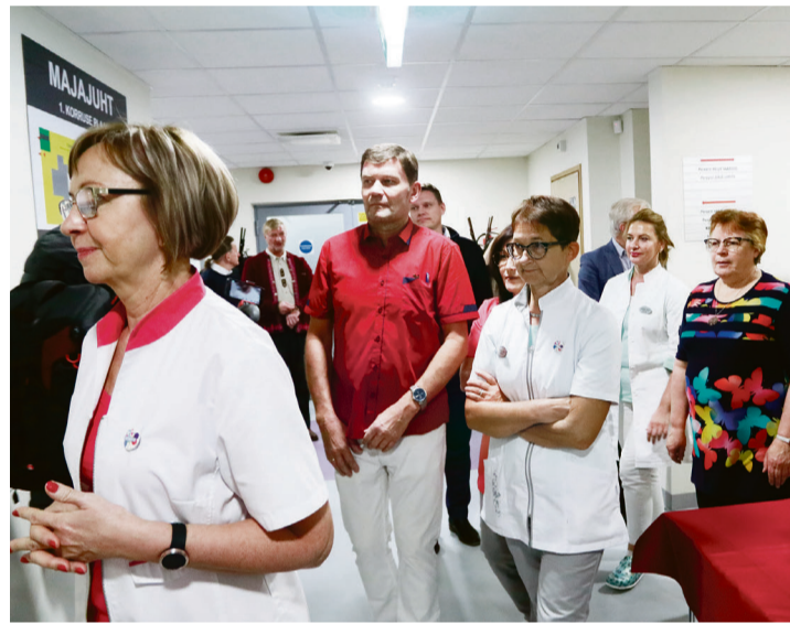
Perearstid leiavad, et praegusel kujul on patsiendikindlustus tervisekassa raha kantimine kindlustusfirmale.