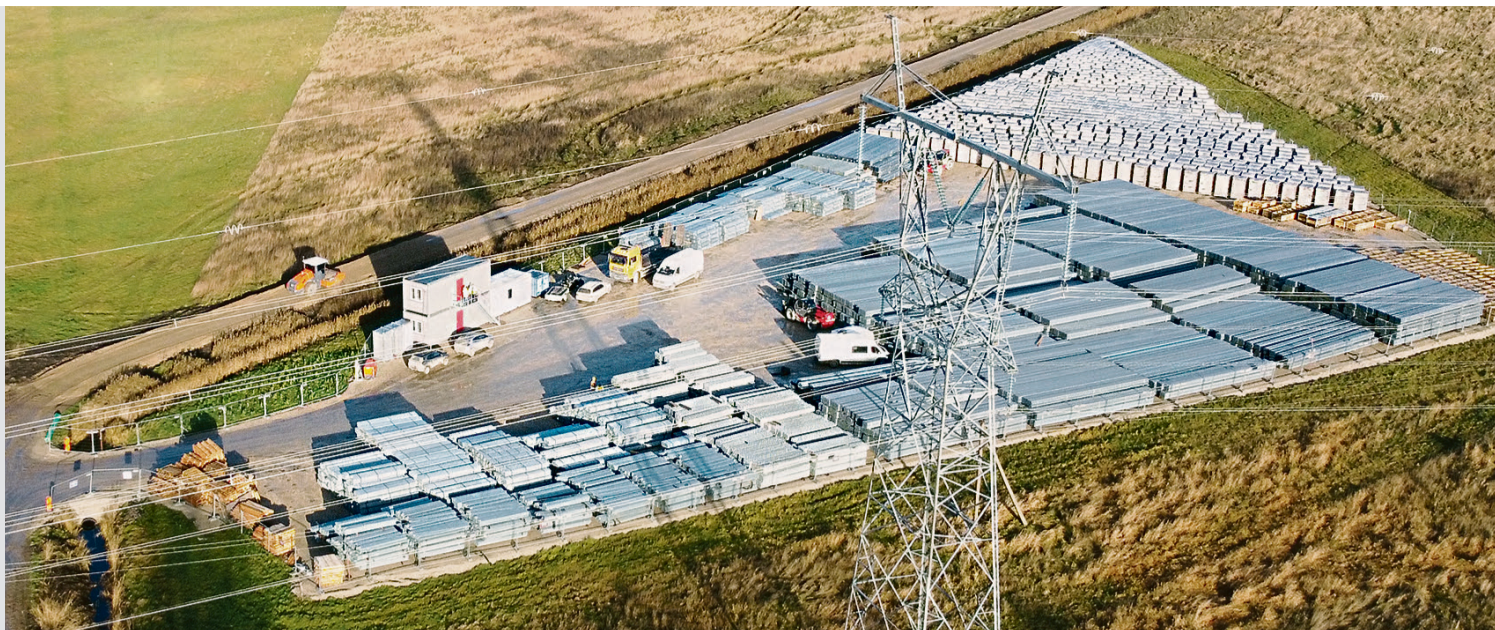
Risti päikeseelektrijaama ehitamisega Rehemäel on algust tehtud, homme keskpäeval korraldab Sunly huvilistele ehitusplatsil tutvumistuuri.