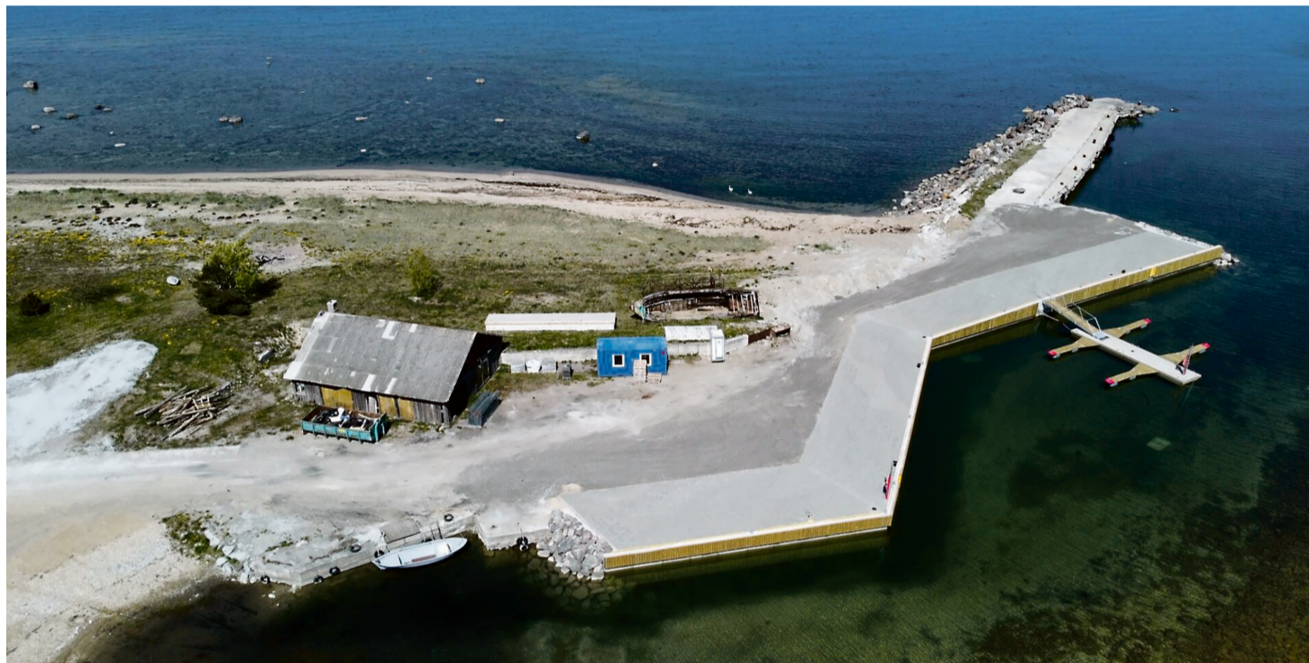
Lääne-Nigula vald sai 200 000 eurot, et Nõva sadama korrastamist jätkata.