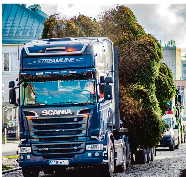
Jõuluvana tõi kuusepuu kirikukellade saatel linna.

Nagu ikka, oli kuuske linna toonud auto roolis jõuluvana, kes jagas Lossiplatsil puu üles panemist jälgivatele inimestele ja möödasõitjatele kommi. Kuuse toomist oli vaatama tulnud ka Tõruse lasteaiarühm ning laste pakkus suurt elevust, et just jõuluvana