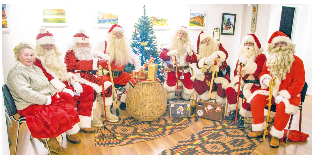
Jõuluvanad pidasid laupäeval rannarootsi muuseumis töökoosolekut.

Nagu paaril eelmisel aastal, ootavad jõuluvanad kõigil advendiaja nädalavahetustel kell 12–18 kuuse all lapsi, kuid miks mitte ka täiskasvanuid. Kindlasti