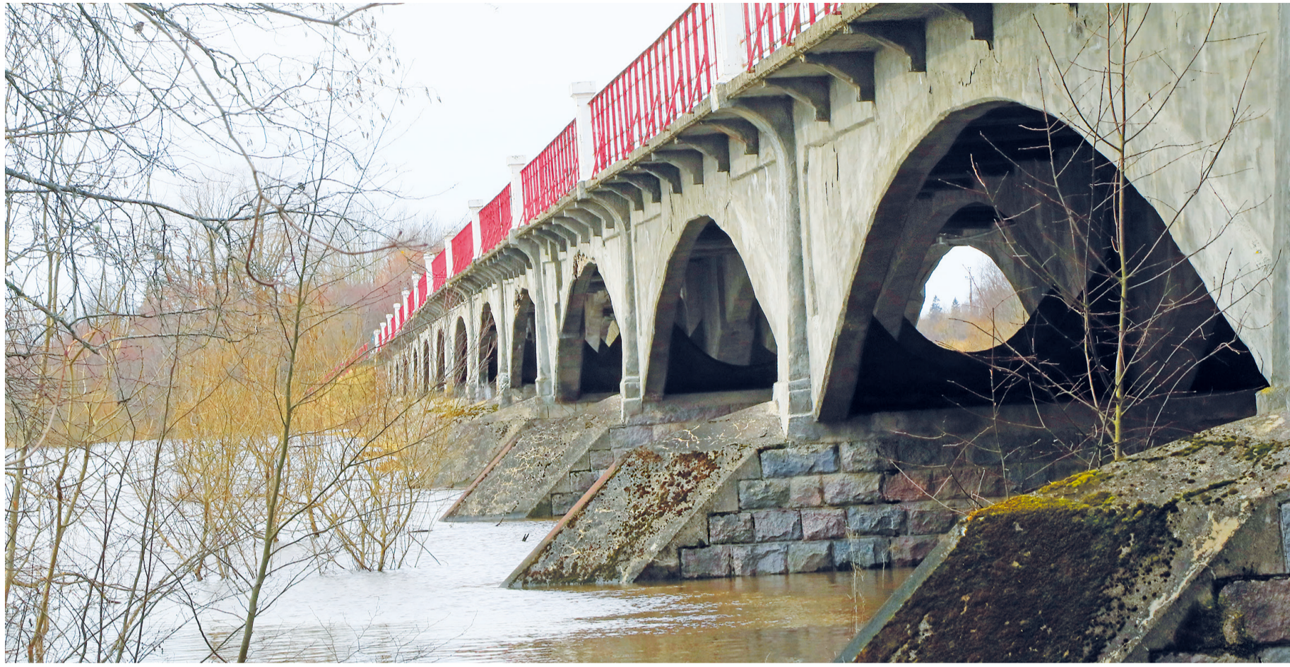
Kui meriforell peaks tõesti Kasari elupaigana koloniseerima, oleks sildade ümbrus just see jõelõik, mis võiks talle kudemiseks sobida.