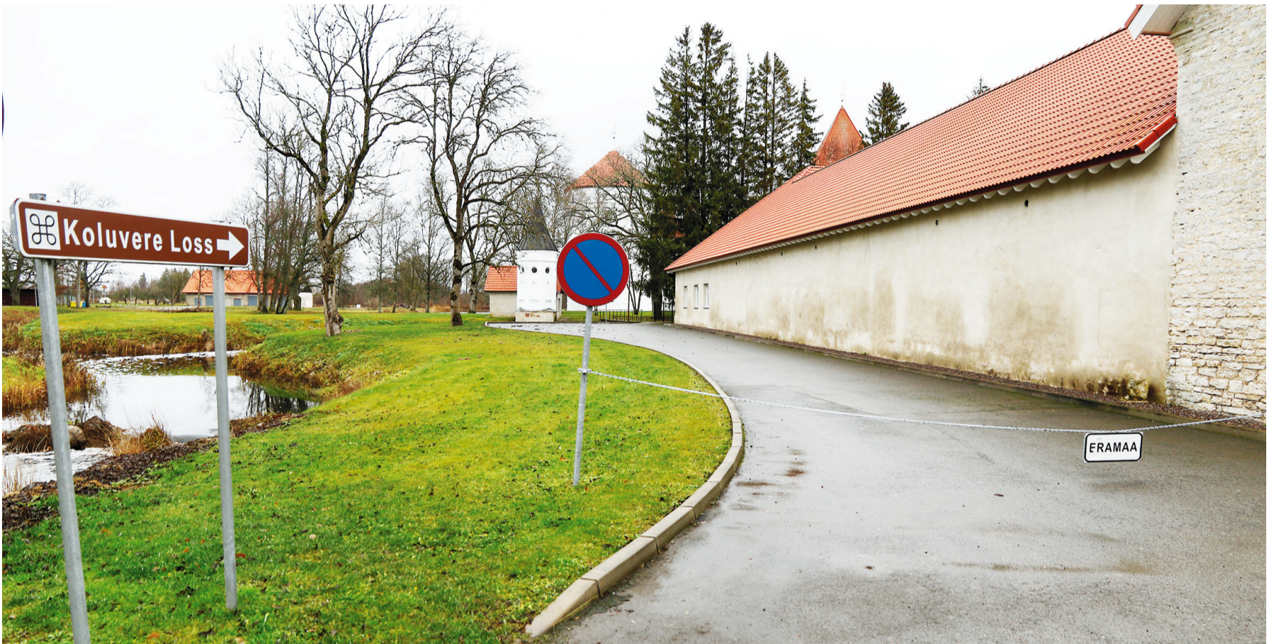
Koluvere poe nurga taga jääv parkla asub lossiomanike maal ja parklasse sõitmist takistab kett.

Praegu saab lossile pilgu peale visata Liivi jõe põhjakaldalt. Seal kulgeva vallale kuuluva Lossi tee lõpus on tõkkepuu ja eramaad tähistav silt keelab ka lossiomanikule kuuluvale kinnistule sissepääsu. Tiiruga minnes pääseb siiski jalgsi taamal asuva Koluvere järveni. Aga järv, nagu ka lossi lähistel voolav jõgi kuni sillani, on lossiomaniku maa peal.