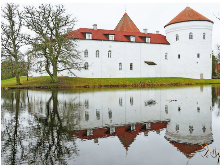
Koluvere järvesaarel asuva lossi on omanikud korda teinud.