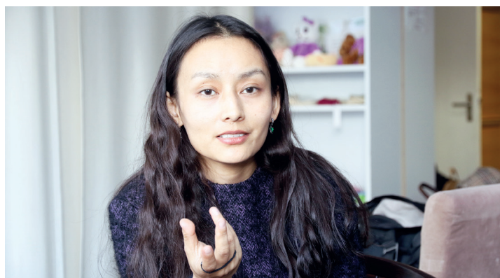
Moefotograaf Dawa Yangchen pildistas üles nii Haapsalu naiste käed kui ka nende näputöö.

paljus kogukonna keskpunkti. Erinevusi on Pengi sõnul loomulikult ka muustrites.