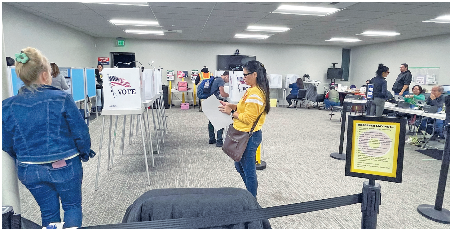
Valimisjaoskonnas sai hääletada nii vanamoodi pabersedeliga kui ka puuteekraani ees.