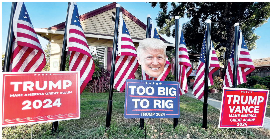
Donald Trumpi toetas Californias 40 protsenti hääletanuist.

Vabariiklastele olid teispäevased valimised edukad mitmel rindel. Võideti tagasi enamus USA Kongressi senatis, tõenäoliselt jäädakse edasi enamusse esindajatekojas. Sellistes oludes on pre-