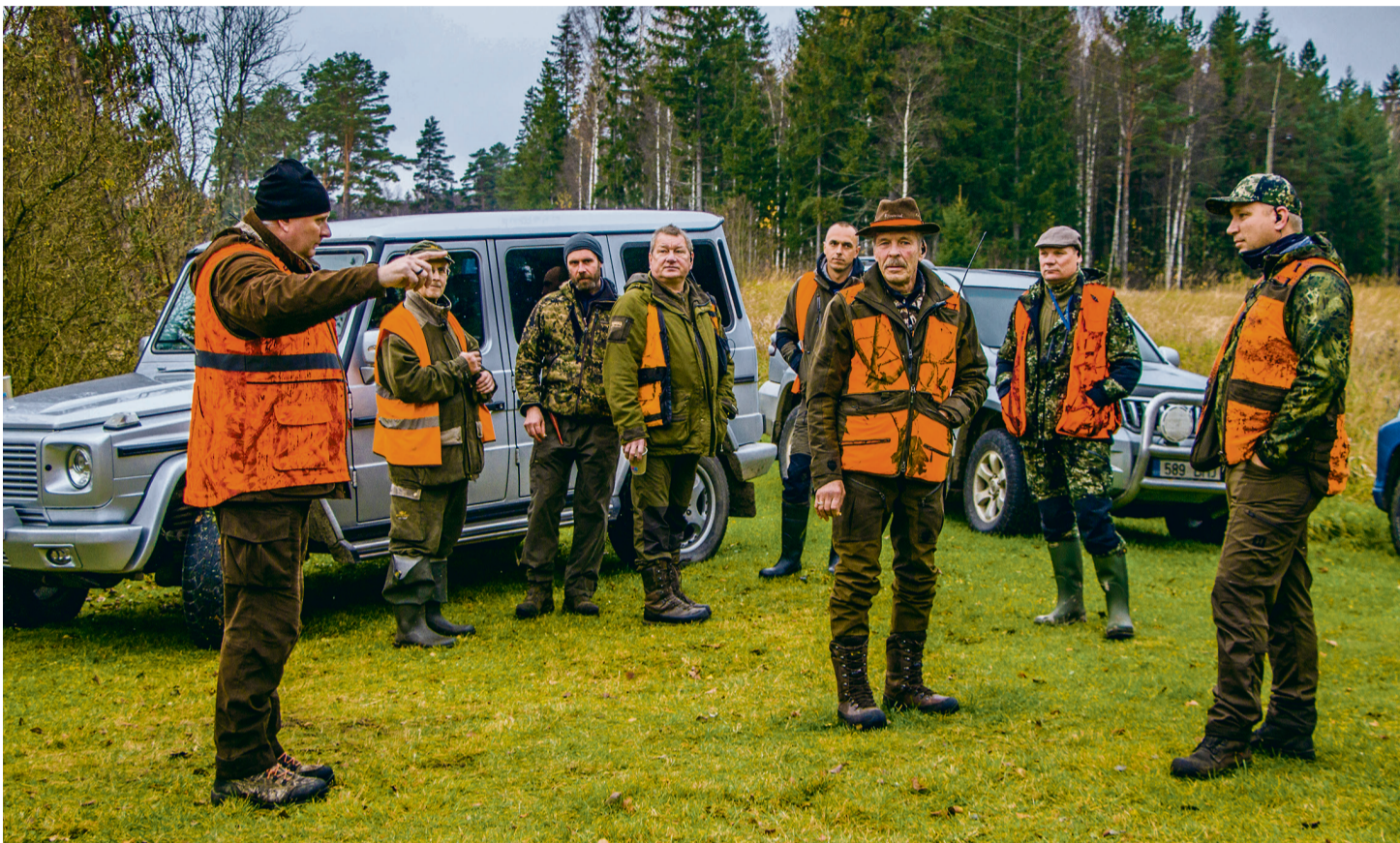
Läänemaa jahindusklubi ühisjahile Riguldise tulli osalisi ka teistest maakonna jahiseltsidest ning kaugemaltki.