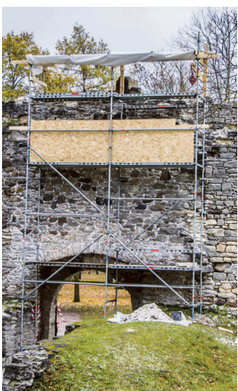
Lahtised kivid aiavärava kohal saavad tugevamini kinni.

Juba on korda tehtud Põlluvärava torni kolme külje ülemine serv, kust tänavu veebruaris kive alla puden. Pärna sõnul olid torni ülemise ringi kivid kinnitatud küll tugevama mördiga, kuid pealt olid kivid mördikihiga katmata. Seetõttu pääses vihmavesi kive vahele ning külmumise-sulamisega loksutas nad lahti.