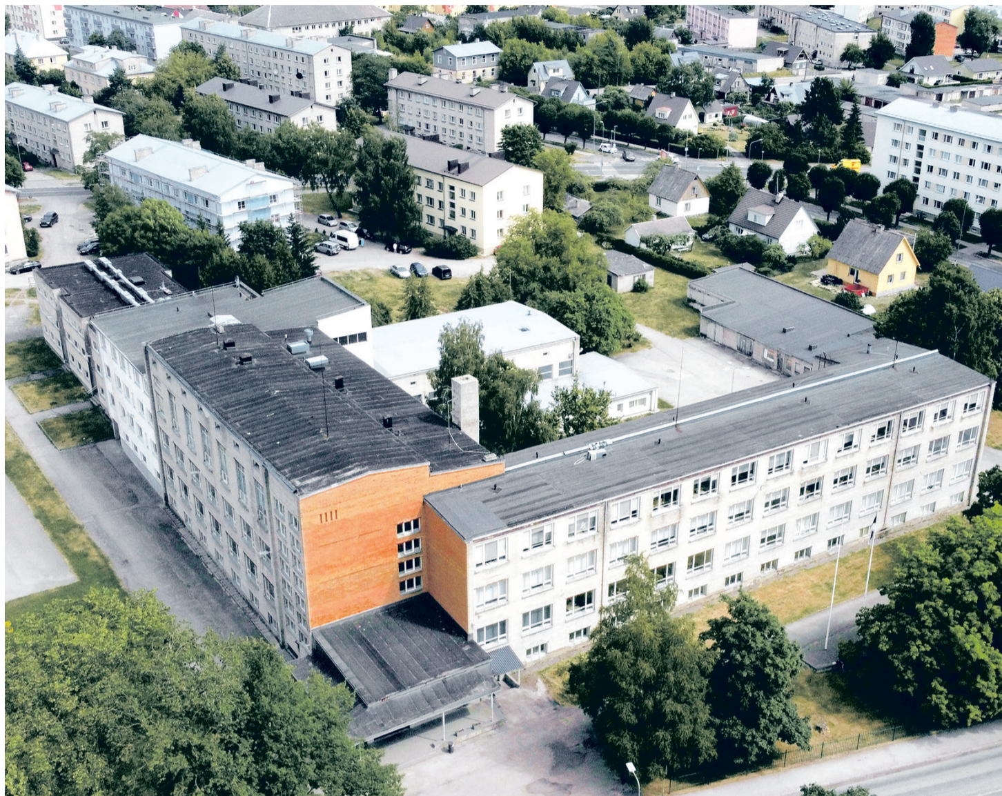
Kui Haapsalu linnavalitsusel õnnestub toetust saada, lammutatakse kogu Kuuse tänava koolimaja kompleks.