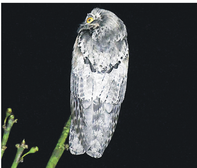
Lõuna-Mehhikost kuni Costa Ricani levinud põhja-tüükasorri on maailma üks omapärasema välimusega linnuliiki.

Chicannále lähim linn on Xpuujil. Siin on olemas kõik vajalik – poed, mõned söögikohad, tankla ja pesumaja. Laste suureks lemmikuks saab pitsakoht, kus on röömsameelsed ja sõbralikud noored mehed, kes räägivad vabalt inglise keelt. Nad lubavad lahkest tulla ka kõõki, et näeksime, kuidas meie pitsad valmistuvad. Hinnad on nii Mehhiko kui ka Eesti mõistes väga soodsaad ning pitsad maitsevad hästi.