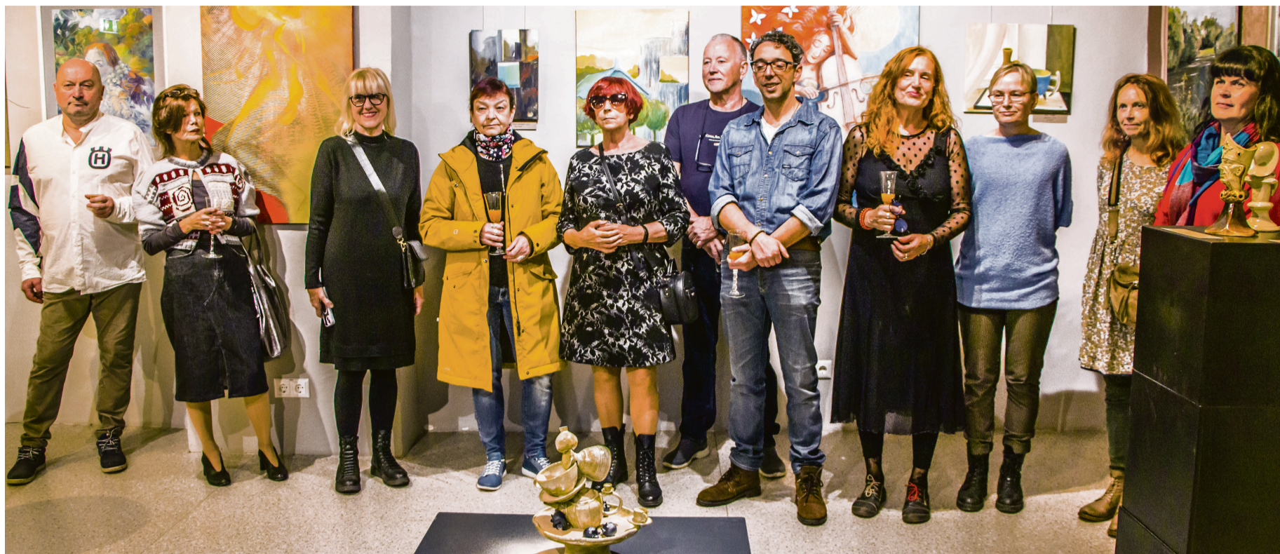
Haapsalu kunstiklubi liikmeid oli avamisel kohal nii palju, et kõik ei mahtunud ühele pildile.

Mõne aasta taguste Haapsalu kunstiklubi ülevaatenäitustega võrreldes on lisandunud uut verd. „Selle üle on hea