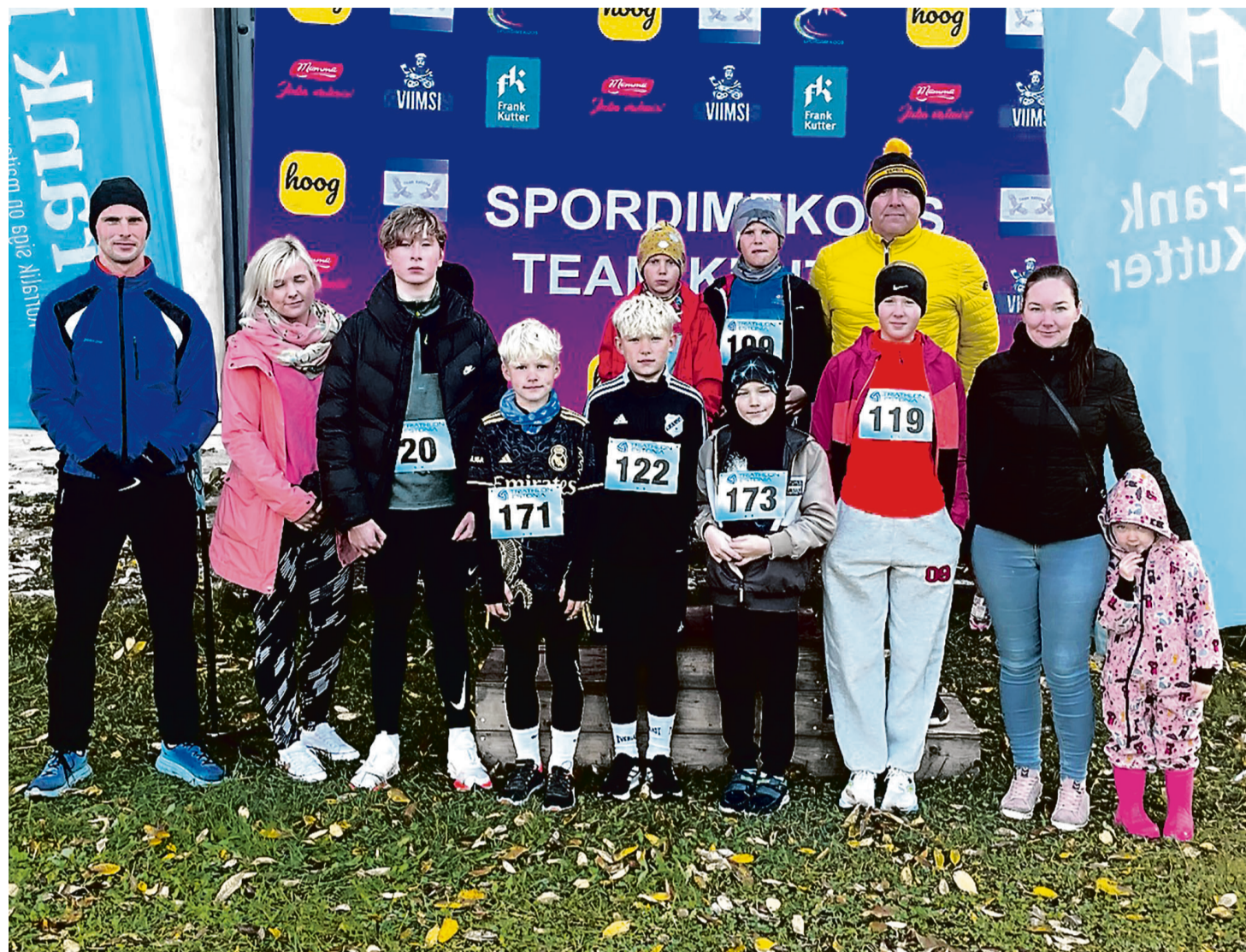
Lõuna-Läänemaa kergejõustikuklubi Fast Feet Estonia liikmed.