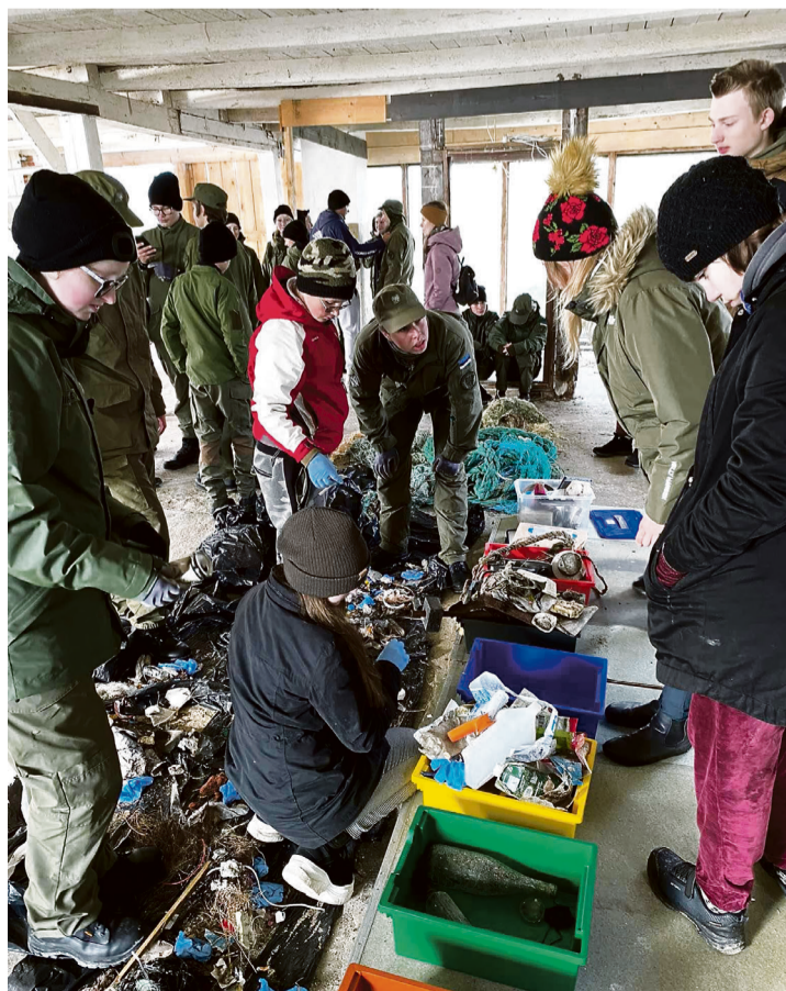
Laagrilised prügi sorteerimas.

Keskkonnahoid on Võsu sõnul noorte väljaõppes väga olu-