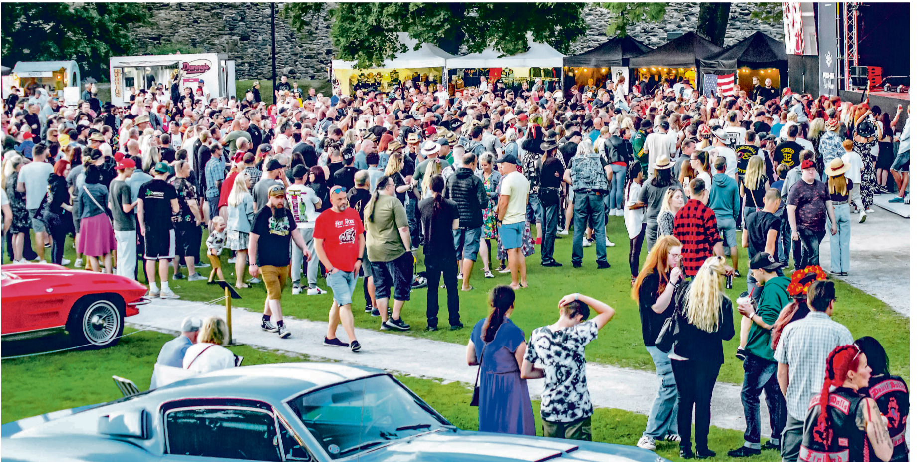
Ehkki Läänemaa üritused ja loodus meelitavad siia palju turiste, ei tõtta omavalitsuste juhid turismimaksu kehtestama.