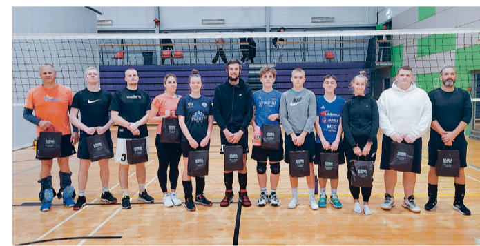
Segavolle avavõistluse parimad.

Herilaste järgmine mäng on 25. oktoobril kell 19.30 koduväljakul. Siis on vastaseks Rapla KK Nobe. MALLE-LIISA RAIGLA