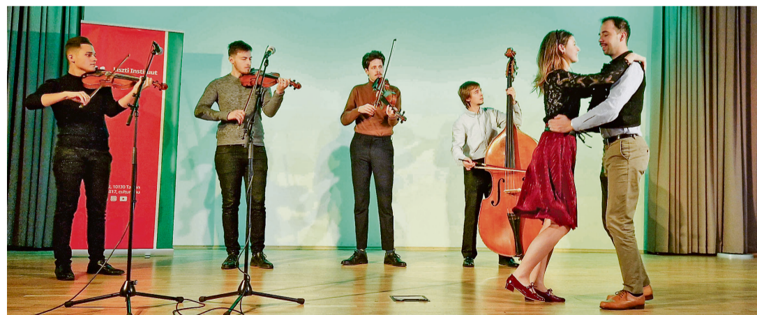
Hõimunädalal tõi Ristile Slovakkias elava ungari vähemusrahvuse rahvapilliansambli ja tantsijad.