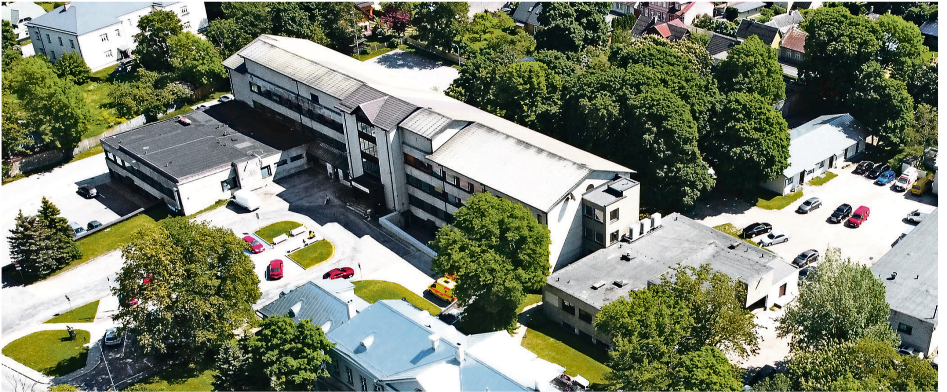
Kogu Eestit hõlmava arengukava järgi peaks Läänemaa haiglast saama kogukonnahaigla.