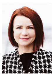
KEIT PENTUS-ROSIMANNUS Euroopa kontrollikoja liige

Kuna ELi reeglid ei sea põllumeestele kohustust toetuse saamiseks midagi toota, pole meil aimugi, kas ja kui palju 12 miljardi eest mahetoitu tegelikult juurde tuli. Kõige ekstreemsematel juhtudel võivad toetust saada ka ammu viljakandmise lõpetanud õunaaiaid või, nagu hiljuti Prantsusmaal juhtus, aakrite viisi koriantrit, mis lõpuks põldudele mädanema jäi. Niikaua, kui talunikud ei kasuta sünteetilisi väetisi ja taimekaitsevahendeid ning täidavad muid nõudeid, pole praegu tähtis, kas ükski maheõun lõpuks turule jõudis.