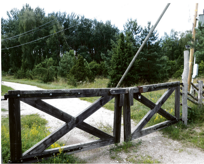
Ramsholmi teel asuv värav on autode jaoks lukus, jalgsi ja rattaga pääseb Ramsi poolsaare tippu jalgvärava kaudu.