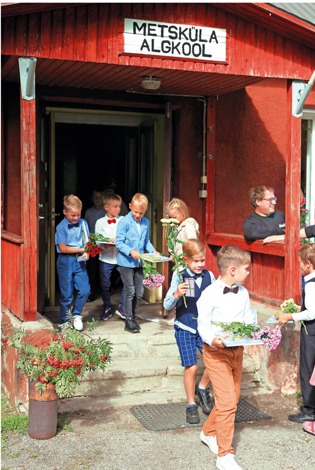
1. septembril pidas Metsküla oma esimest aktust erakoolina.

Teisipäeval välja kuulutatud otsusega jättis ringkonnakohus õiguse kohalikele omavalitsusele ja nõustus halduskohtu seisukohaga, et Lääneranna vallavolikogu otsus Metsküla kooli kinni panna ei riku lapsevanemate õigusi, kuna nende lapsed võivad saada haridust mõnes teises muunitsipaalkoolis. Ringkonnakohus leidis, et Metsküla kooli sulgedes ei ole Lääneranna vallavolikogu seadust rikkunud.