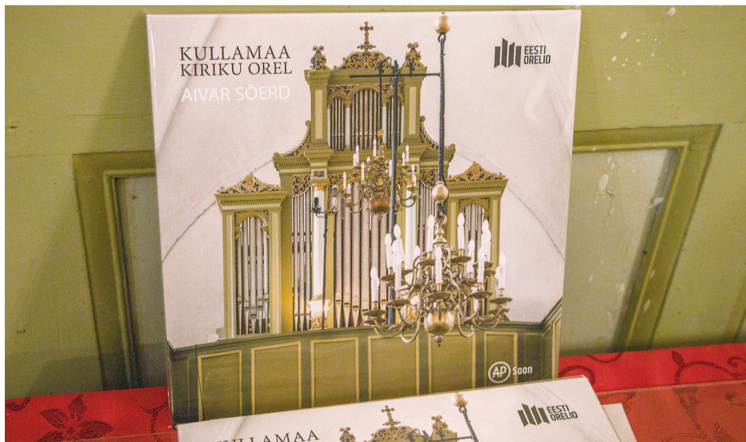
Kullamaa kiriku orel vinüülplaad on väikese plaadifirma AP Soon viies plaad.