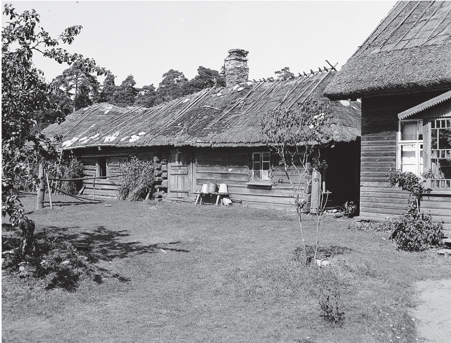
Erjase talu vana elamu Vormsi Hokabakanil 1939. aastal.