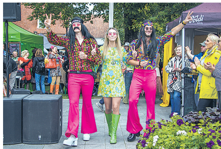
Hipiilik mood lööb jälle laineid. Vähemalt alt laiad püksid on taas moes.