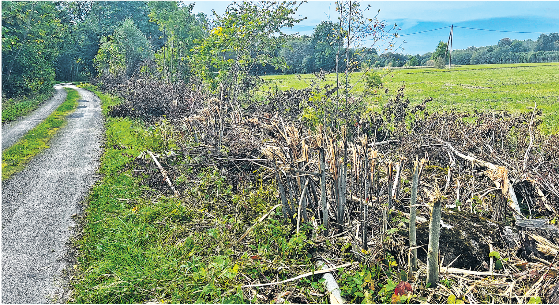
Giljotiiniga saab teeäärse võsa kiiresti maha, kuid turritama jäävad meetrikõrgused tüükad mõjuvad öövastavalt. Vaja oleks saamehi.