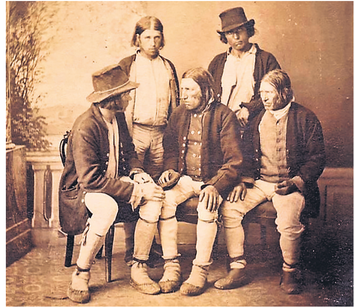
Lundi arhiivist leiti 1861. aastal tehtud foto, kui Vormsi talupojad käisid Rootsi kuninga juures oma raske elu üle kurtmas.