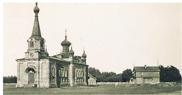
Võlgadest ja mõisa survest pääsu ja tsaari kaitset otsides siirdusid 1886. aastal sajad vormsilased vene õigeusku.

EESTI TEADUSTE AKADEEMIA KODU-UURIMISE SELTS