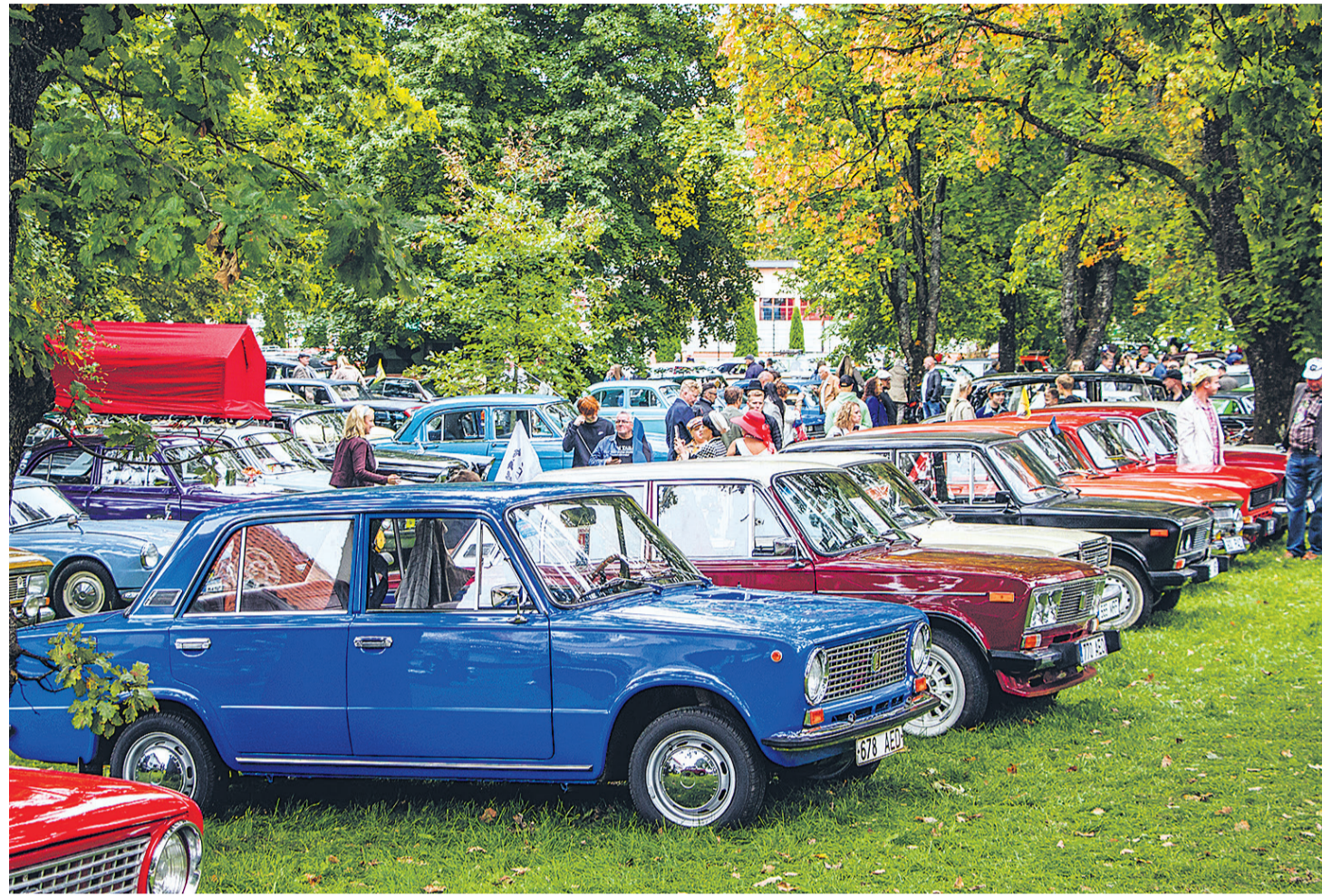
Vintage Weekend võttis nostalgiapäevadelt teatepulga üle nii, et osalejad ei saanud arugi, et midagi oleks muutunud. Retropidu algab reede õhtul kella 21 paiku traditsiooniliselt See teatri juures.