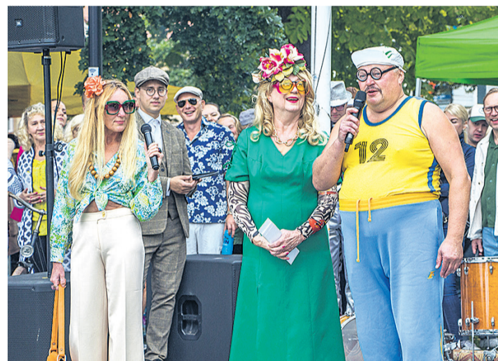
Kolhoosiaegsed nokkmütsid on kuum kaup.