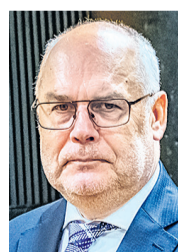
ALAR KARIS Eesti vabariigi president

See peabki olema põhiline küsimus, mille järele joonduvad kõik muud. Haridus ei tohi jääda muga-