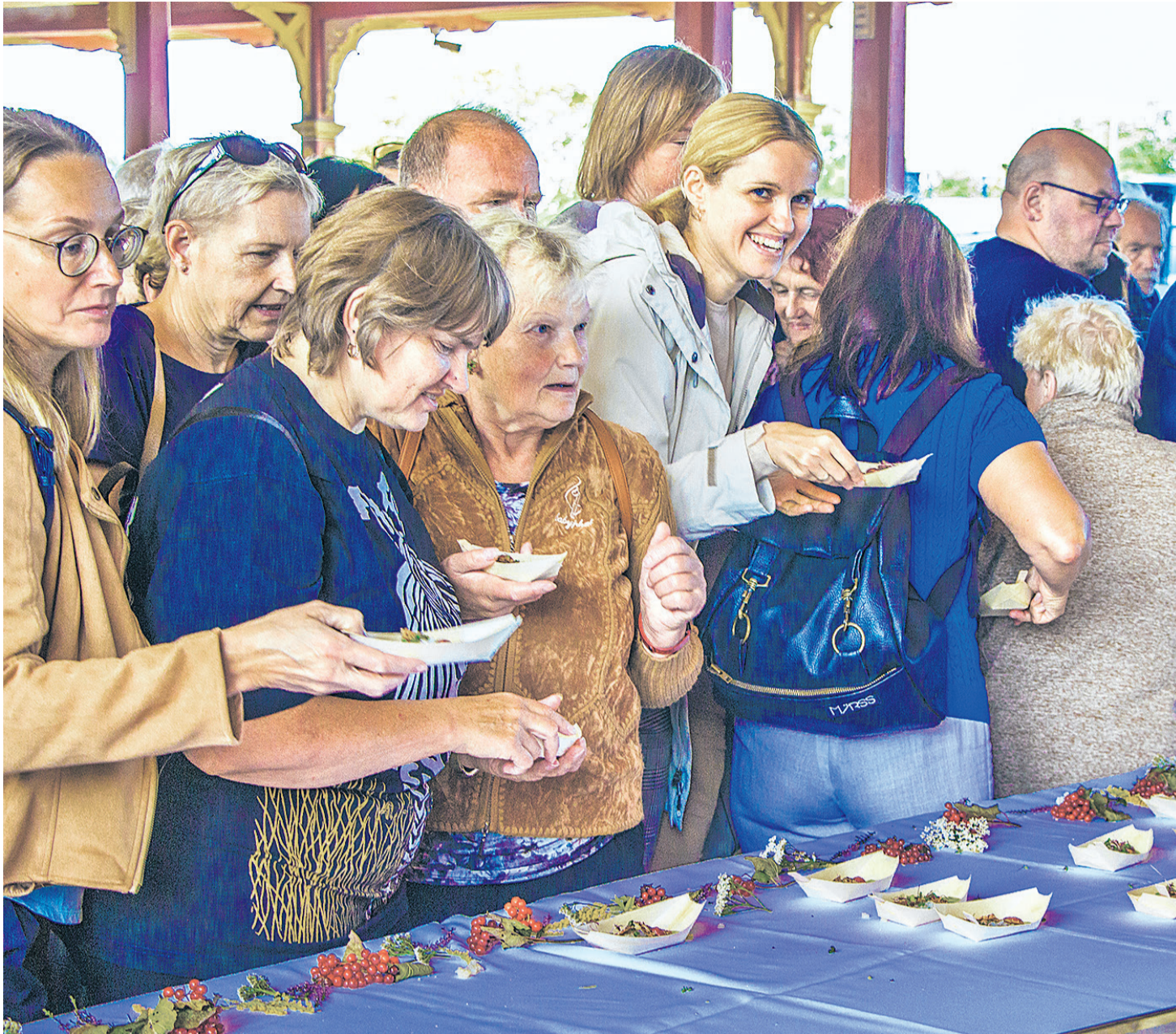
Maitsemiseks pakutud 400 portsu siiga kadus laualt üsna kiiresti.