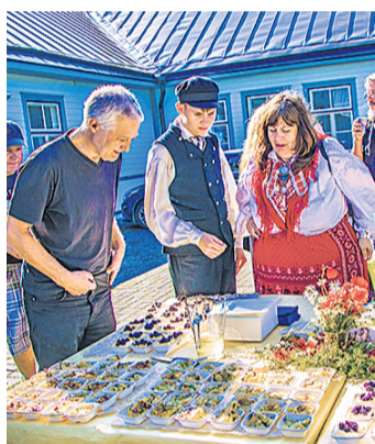
Mekkida sai eestirootslaste roogi.

seid jumalateenistusi ja seal käisid vahel Vihterpalu rootslased, pole Nõva kohanimedes jälgi vanemast rootsi asustusest. „Mina väidan, et Nõva rootslus on suuresti kultuuriline,” ütles Raat. Tema sõnul on Nõval tahetud olla ümberriingi elavate rannarootslaste moodi ning seda märkab kultuuri- ja keelelaenuks. Raat lisas, et kindlasti on Nõva kui rootsikeelse piirkonna müüdi le hoogu andnud seegi, et Rannakülas ostsid talusid Naissaarelt tulnud rootslased ja nii võis rootsi keelt Nõval kuulda veel nõukogude aja alguseski.