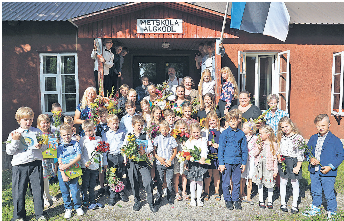
Metsküla koolipere esimesel koolipäeval.

Lapsed õpivad koolimajas, mis on ehitatud 1912. aastal. Aktusel kõlasid sõnad, et Metsküla kool on vanem kui Eesti riik. Kõsimusele, mis oleks Metskülas,