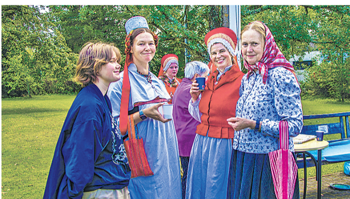
Nõva kultuuripäevale tuldi esinema nii Vormsilt kui ka Noarootsist.