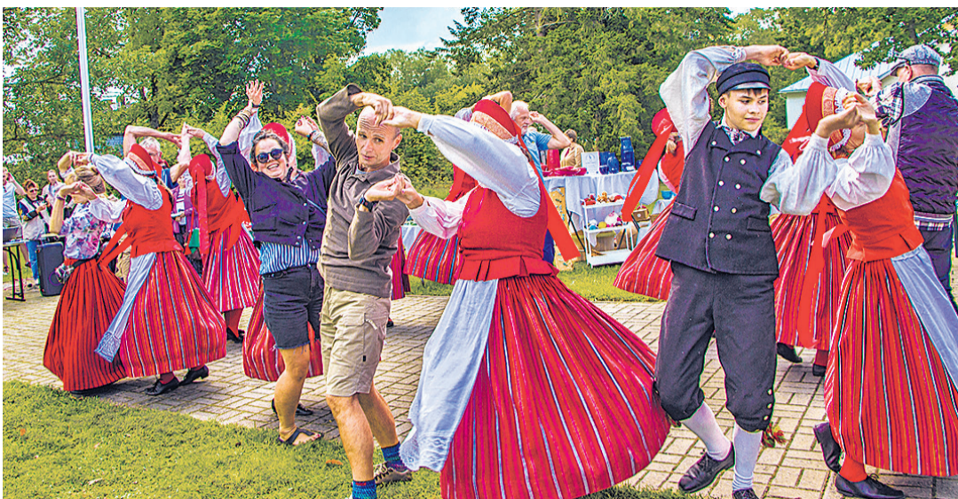
Noarootsi naised haarasid tantsuringi ka publiku.

Filmimees Marko Raat on püüdnud arhiividest leida jälgi Nõva piirkonna rootsi asustusest, kuid pidi tõdema, et kuigi Nõva kirikus on peetud ka rootsikeel-