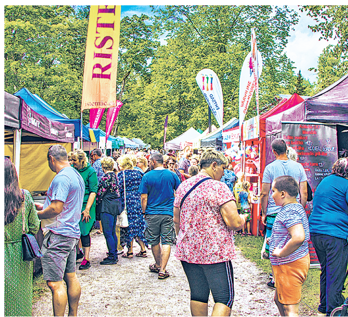
Käsitöölasi meelitas promenaadile hulganisti uudistajaid.

Kui Aafrika ranna laval astusid üles tantsijad alates rahvatantsijatest kuni peotantsu ja bal-