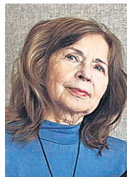
IIVI ZAJEDOVA Praha Karli ülikooli õppejõud

Siis ei teadnud ma veel, et jõuan hiljem välja Euroopa Liidu projekti „Euroopa traumaatilise mälu –