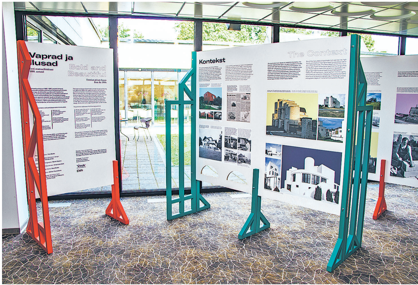
Ka näituse „Vaprad ja ilusad” kujundus meenutab 1980ndaid, mil projekteeritud majadest see räägib.

Sageli pandi pooleliolevad majad ka müüki. „Omaniku vahe-