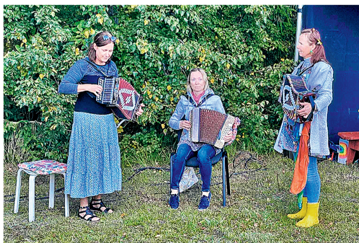
Löötsamuusika tõi Jalukse simmanile 150 inimest.