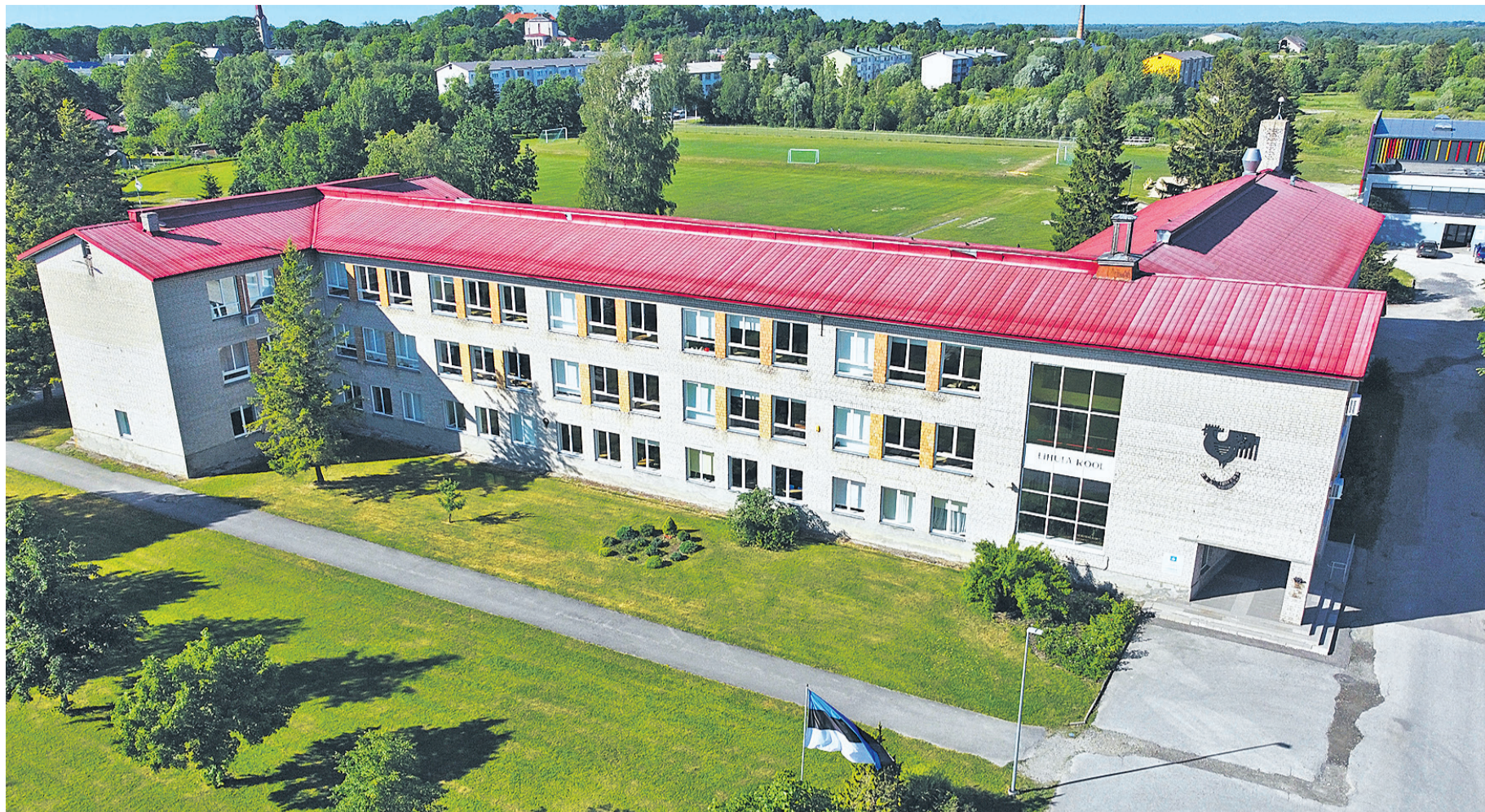
Lääneranna gümnaasiumi suurim õppekoht saab olema Lihulas, kus käib koolis ligi 300 õpilast.