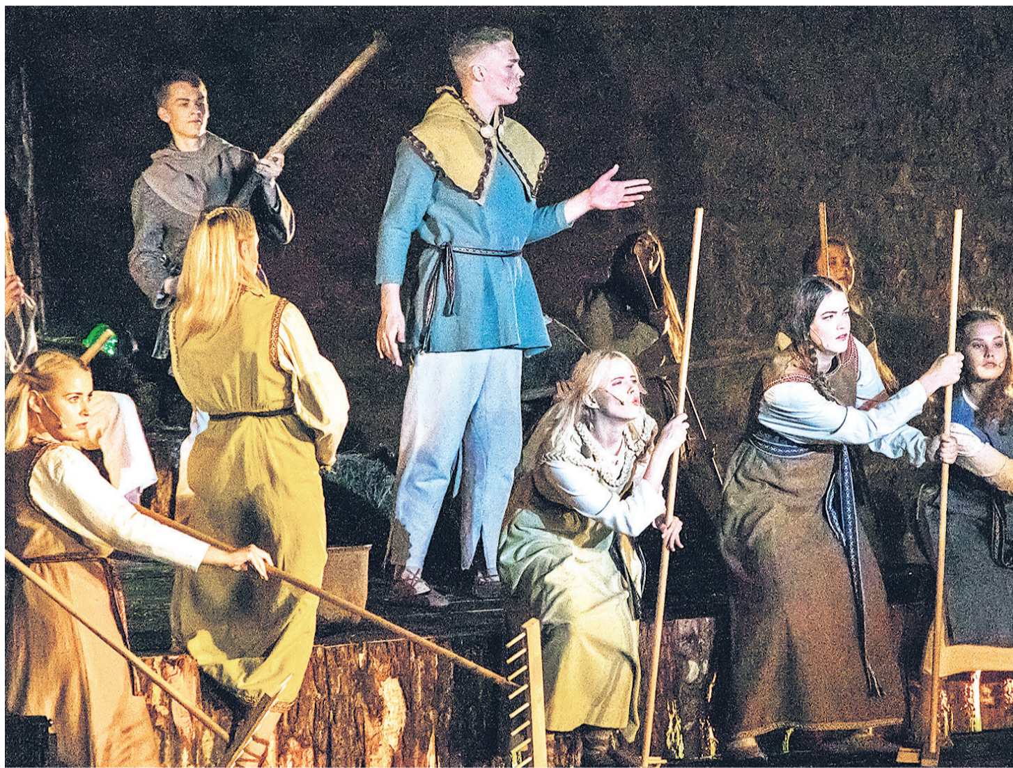
Sel aastal on viimane võimalus näha vabaõhuetendust „Maila”.