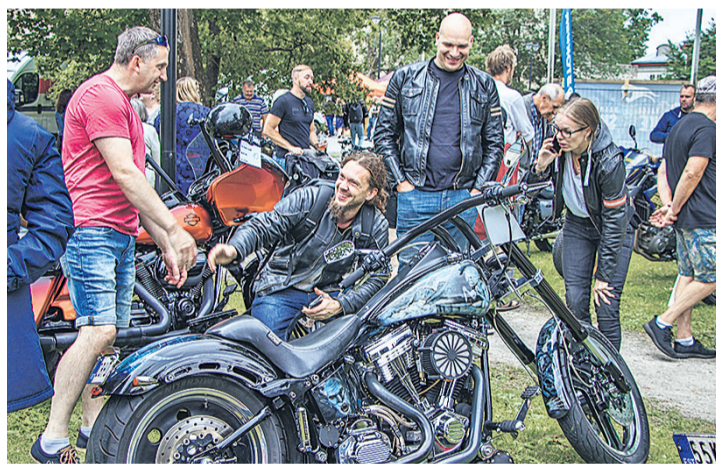
Mootorratturid toovad oma rattad näitusele.