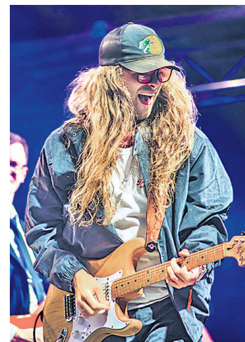
Fender Stratocasteri kitarr tähistab tänavu juubelit.