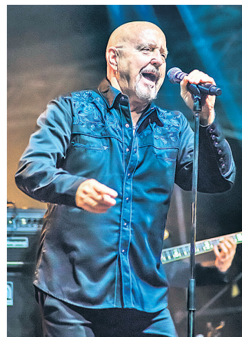
The Fabulous Thunderbirds.