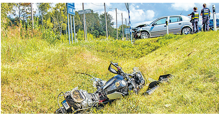
Pärast kokkupõrget lendas mootorratas maanteekraavi.

Avariitoomus kl 13 Ääsmäe-Rohuküla 58. kilomeetril, Ridala-Nigula tee ristmikul. Haapsalu politseijaoskonna väljuhi Lauri Pöllula sõnul sõitis mootorratas Haapsalu suunas ja sõiduauto Opel tahtis sõita Ridala-Nigula maanteelt otse üle Tallinna