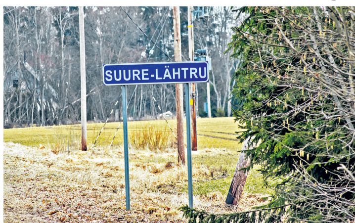
Veebruaris leiti Suure-Lähtrust elutu vastsündinu.

Politsei esitas naisele kahtlustuse ning kriminaalmenetlus käib paragrahvi järgi, mis kä-