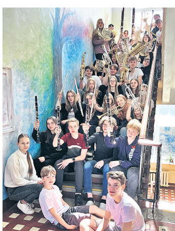
ENPO projektorkester. ERAKOJU

1994. aastal asutati Eesti koorihingu juurde Eesti noorte puhkpilliorkester. Sellest ajast