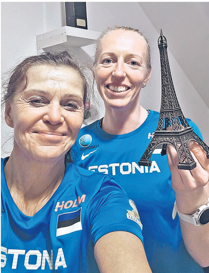
Märtsis selgus Budapesti etapi järel, et olümpiapäase on käes.

Enamikuga vehklejatest käiakse tee läbi algusest lõpuni koos. Differtiga on koos käidud juba 24 aastat. Tema treener on klassikalise koolkonna pooldaja.