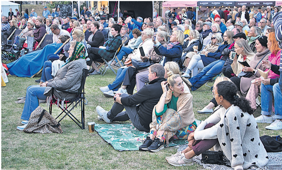
Festivalil valitses hubane meeleolu.