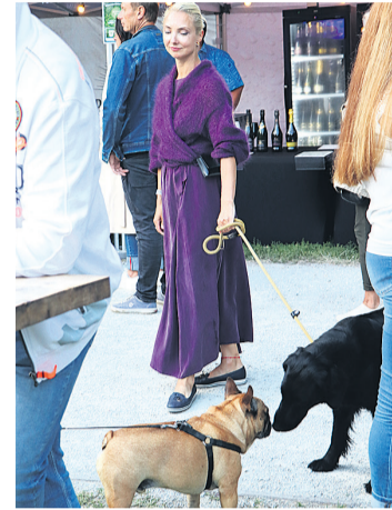
Lemmikloomad olid lubatud.