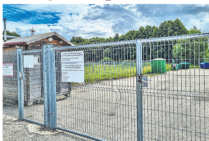
Keskkonnajaama väravad on tabalukuga kinni.