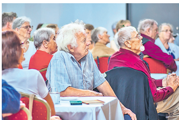
Suvepidu tõi Oru kultuurisaali eakaid paksult täis. MALLE-LIISA RAIGLA

Õues toimuvale peole oli eeldatud, et tuleb umbes 170 inimest. Kuna pidu koliti siseruumi, arvas Paaliste, et inimesi tuleb kokku vähem. Tegelikult tuli aga korraldajate üllatuseks suvepeole ligi 300 eakat. „Ei tea, mille järgi arvu prognoosida,” ütles Paaliste.