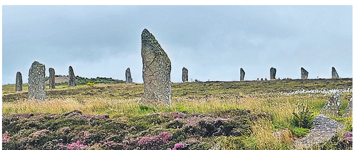
Brodgari kiviring on Suurbritannias suuruselt kolmas.

Kolmele püstisele kivile lisaks on Stennessis kaks madalamat, mille kõrval lebab kiviplaat, mis pool sajandit tagasi toetus veel madalamatele kividele ja meenutas muistset altarit. Tegelikult oli muistne altar puhas pettus: püsti pandud 1907. aastal, ilmselt saades inspiratsiooni Walter Scotti raamatust „Piraat“, kus sellist altarit on kirjeldatud. Sel ajal 19. sajandi alguses, kui Scott Stennessis käis, oli seal veidi rohkem kive näha, kuid mõni kuu hiljem hakkas kohalik talumees muinasmälestist lõhkuma ja kasutama kive lauda ehitamiseks. Talumehele ei meeldinud kiviring, sest inimesed käisid seda vaatamas ja väidetavalt trampisid tema põllul.