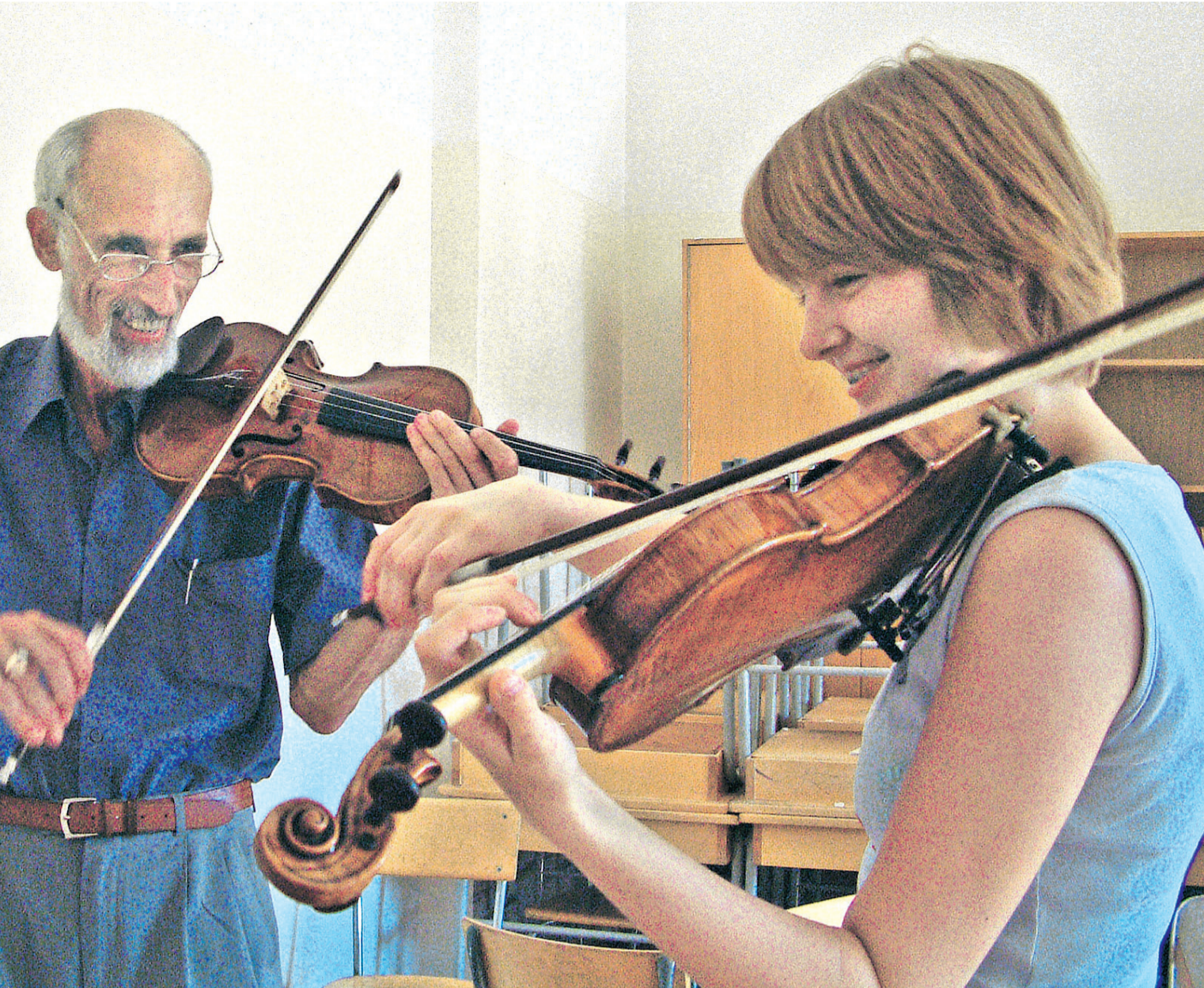
el pillimängijate suvekursusel.