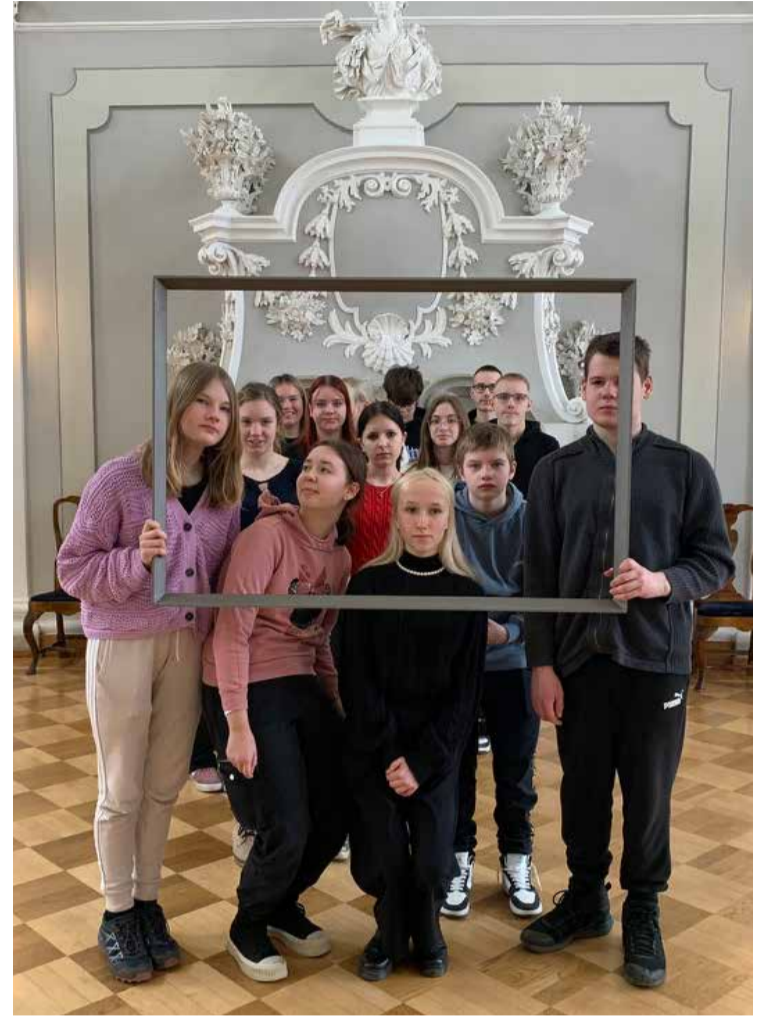
Õppekäik Tallinna muuseumides – töötuba „Portreede saladus”.