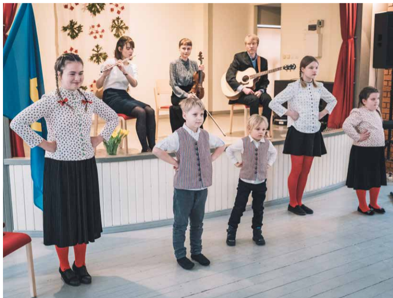
Pärimusmuusikud (laval) ja Vormsi õpilased andsid rahvamajas sooja kontserdi.