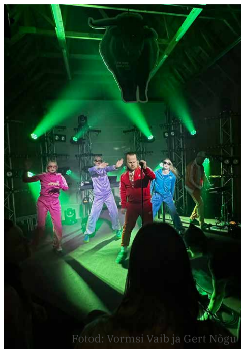
Fotod: Vormsi Vaib ja Gert Nõgu