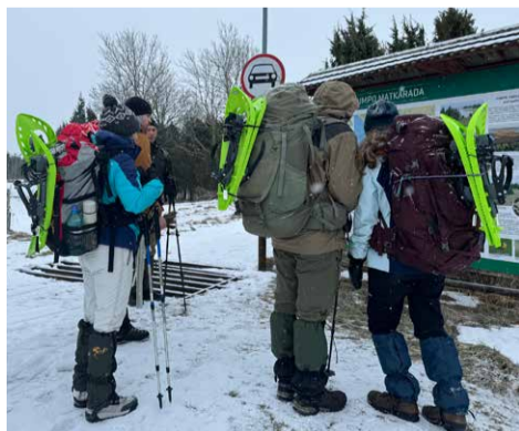
Räätssamatkalised Rumpos.

Kui midagi kasutada soovid, siis kirjuta julgelt info@vormsikraam.ee .