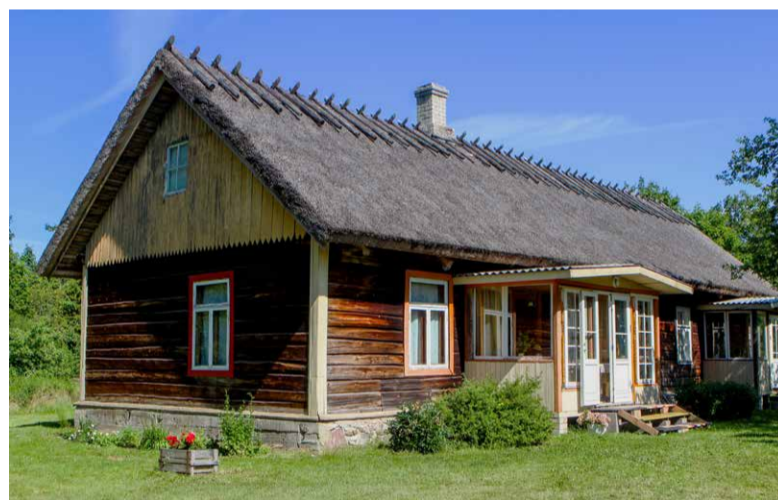
Peetruse talumaja hoovi poolt.

Meeme: Vana rookatus lasi läbi ja hakkasin uut katust valima. Vormsis käisid ühed rookatusmeistrid, nendelt sai hinnapakkumine küsitud ja see oli võrreldes plekk-katusega veerandi jagu soodsam. Sarikad ja roovitus jäid samaks, seetõttu sai lihtsamalt. Plekk-katus eeldab head tassist aluspinda.