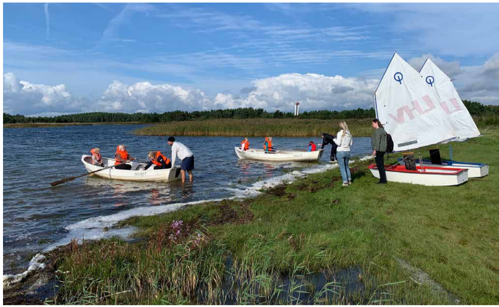
Ühine purjetamine rannapäeval Svibys 4. septembril.