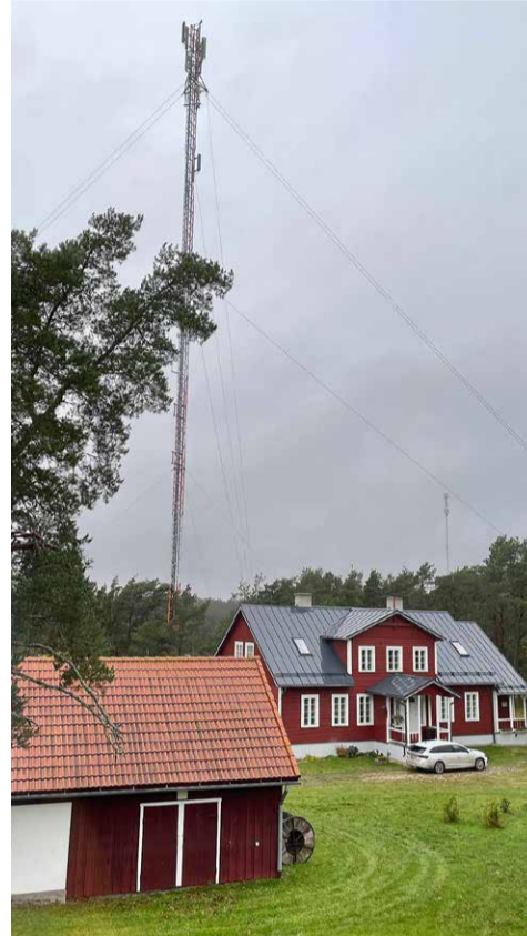
Lisaks kahele mobiilsidemastile peaks Vormsi järgmise aasta lõpuks tänu toetusele saama juurde kaks uut masti.

Toetused ei tule niisama – väiksemadki eeldavad tööd, mis omakorda tähendab investeerimist inimestesse, et jätkuks