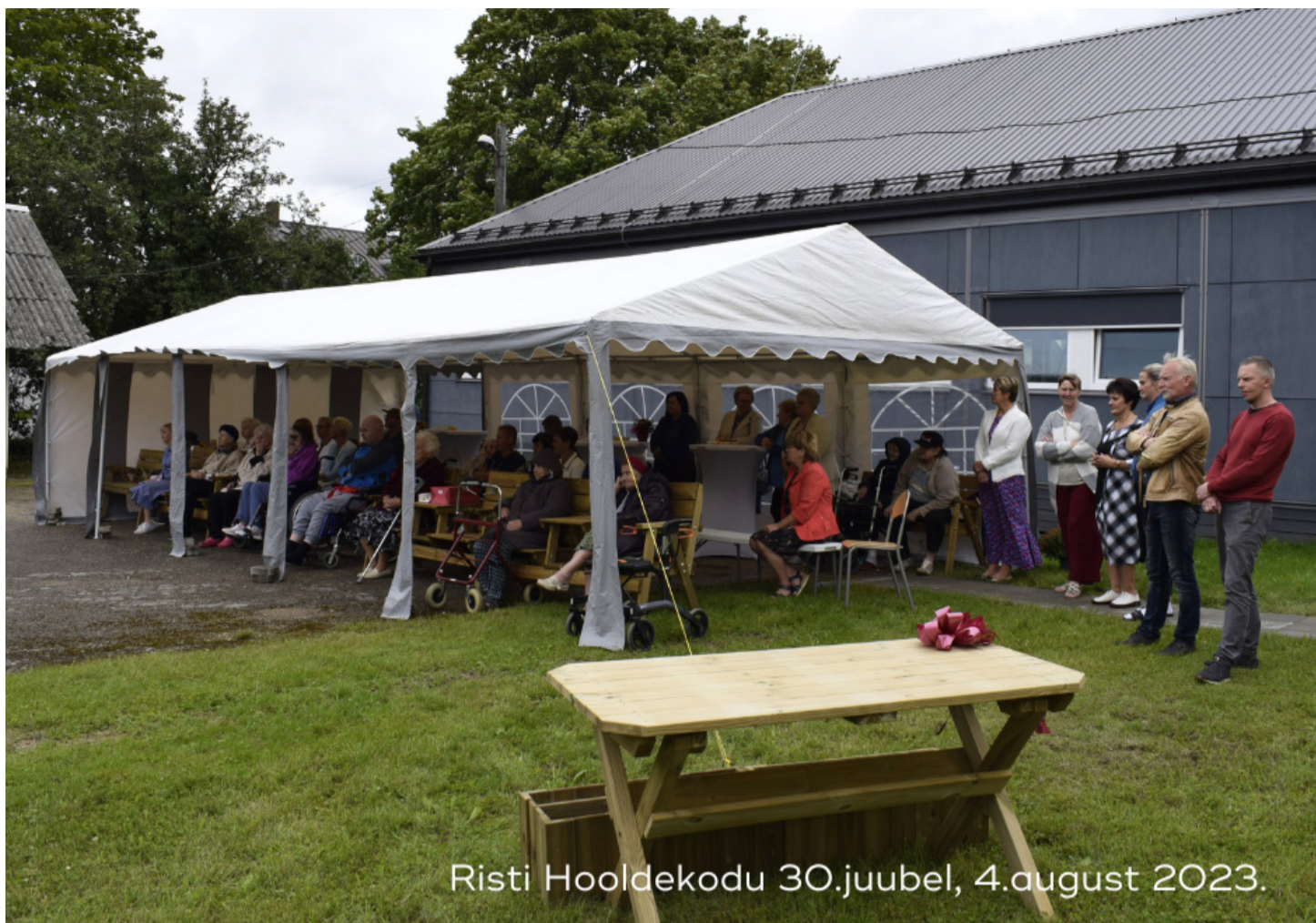
Risti Hooldekodu 30. juubel, 4. august 2023.