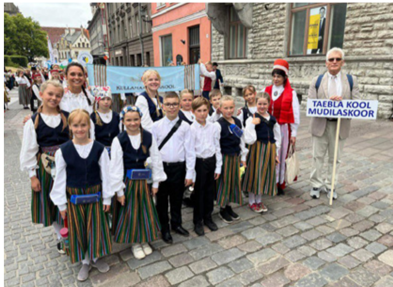
Taebbla kooli mudilaskoor laulupeol.