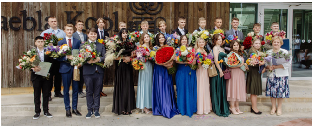
Taebbla kooli 9. klassi lõpetajad.