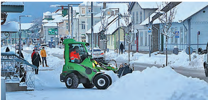
Haapsalu jagab kõnni- ja sõiduteede puhastamise eri firmade vahel.

Talihooldusele kuluv summa suurenes mitme asjaolu tõttu: kallinenud on teenuse hind, pikenenud on soovitud talihoolduse aeg ja varasemaga võrreldes on suurenenud ka tänavate maht.