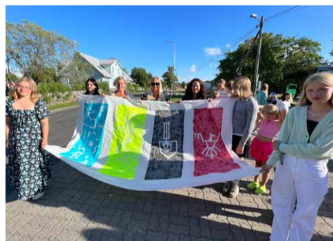
Fotol laagri lipp koos laagrilistest külavanematega.

Laagriliseks ristimine toimus Hosbys Skärestain rändrahnu juures. Teisel päeval osalesid kultuuriuurijad Vormsi Talumuuseumi õuel erinevates töötubades, kus õpiti herbariseerimist ja ümbriku voltimist tänukaartide valmistamiseks, tutvuti saunarituaalidega, meisterdati puutööna oma peremärgiga templeid ning mõeldi välja Vormsi tantsuelemente sisaldav tants, mille saatemuusika oli mõistagi Puuluupi repertuaarist. Muuseumi tallis vaadati öökino filmi „Kevade“.