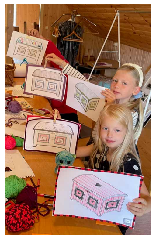
* Laste nägemus Vormsi kirstust on kui nägemus tuleviku Vormsist.

Samuti pidid lapsed talumuuseumis lugema kokku Vormsi kirstud. Seejärel kujundasid nad enda Vormsi kirstu.