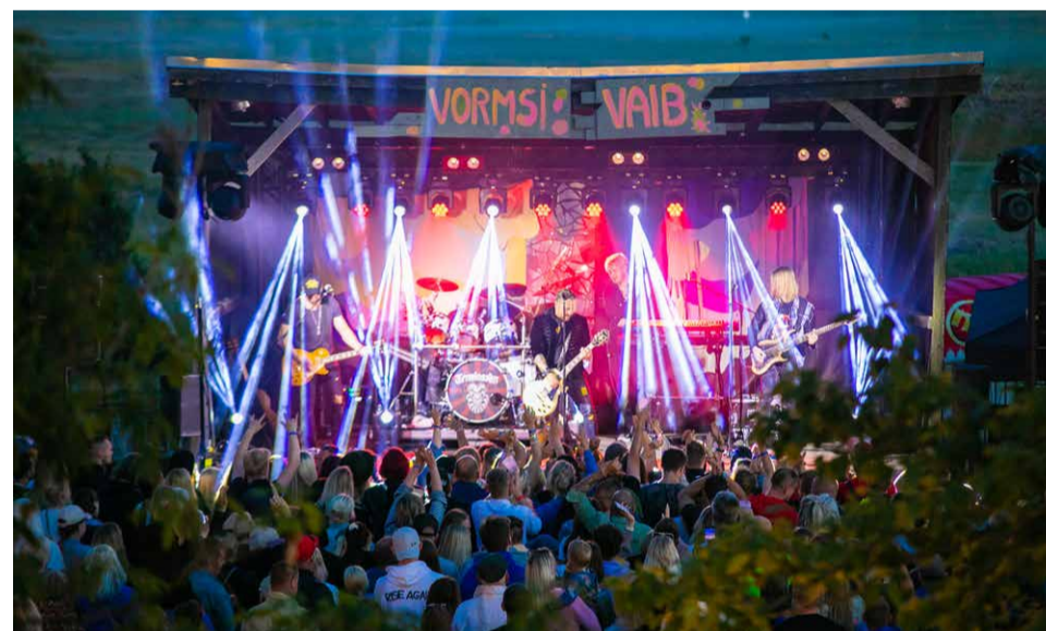
Peaesineja Terminaator Vormsi suveöös.