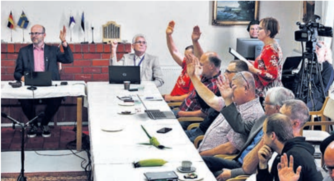
Kuigi volikogu oli ülekaalukalt tuulepargi rajamise poolt, kostis ka kaalukaid vastuväiteid.

Vallavanema sõnul on võimalik, et lisaks Enefit Greenile tehakse koostööd ka teiste arendajatega. „Peame tegema vallavalitsus-