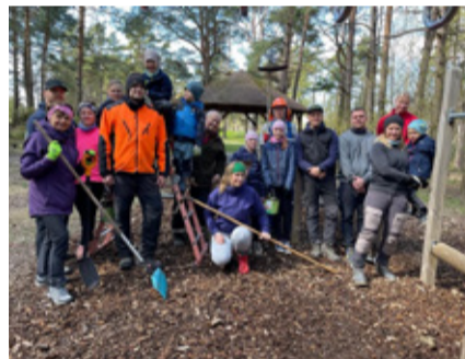
Talgud Linnamäe disc golf'i rajal.

TAEBLA KOOL OOTAB KOKKTULEKULE OMA ENDISI ÕPILASI, ÕPETAJAJD JA KOOLITÖÖTAJAJD.