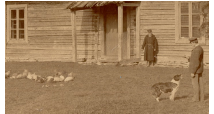
Rudolf Tobias (paremalt esimene) Kullamaal.

7. juunil 1992 jõudis helilooja põrm kodumaale ja sängitati 17. juunil kell 19 annavad