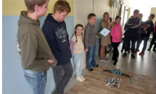
Robotika päev Martnas.

edukaid olümpiaadidel osalemisi, projekte, külalisi ja ettevõtmisi. Näiteks meie 7. klassi poolt algatatud ja korraldatud suur koristuspäev Martna külas, kuhu nad partneritena kutsusid osalema nii Martna osavalla kui ka Martna lasteaiast. Hoog sai sisse lükatud taaskord algatatud Erasmus+ projektile, kus seekord teeme koostööd viie erineva partneriga Itaaliast, Horvaatiast, Rumeeniast, Belgias ja Prantsusmaal. Planeerimisfaasis on juba ka mitmed põnevad projektid sügiseks, kuid sellest kuulete juba siis, kui aeg sealmaal on.