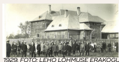
1929.