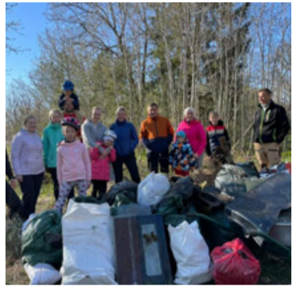
Saunja küla talguleid.