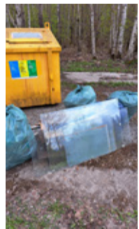
Nigula küla talgud.