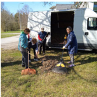
Talgupäev Paliveres.