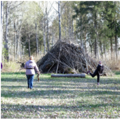
Linnamäe pargi talgud.

6. mail toimusid talgud ka Saunja külas. Koduküla teede ääred said prügist puhtaks ja jõuti ka Kirimäe saare randa koristama. Osales 20 talgulist – nii külalanelikke kui ka külalisi. Õhtul saadi kokku lõkke ääres ja tunti rõõmu tehtud töö üle. (Helina Laht)