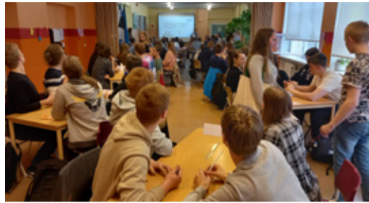
AÕA ehk Arukate Õpilaste Akadeemia.

Nende kahe suure projekti vahele mahtus veel hulgaliselt igapäevaseid erinevaid tegevusi - õppekäike,