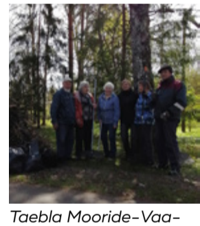
Taeblass Mooride-Vaaride ja Taeblass Söögipeatuse koostöö.