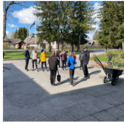
Talgud Kullamaa keskkoolis.