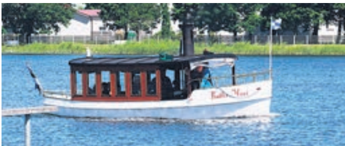
Viimati sõitis Kallis Mari Väikesel viigil 2019. aastal.