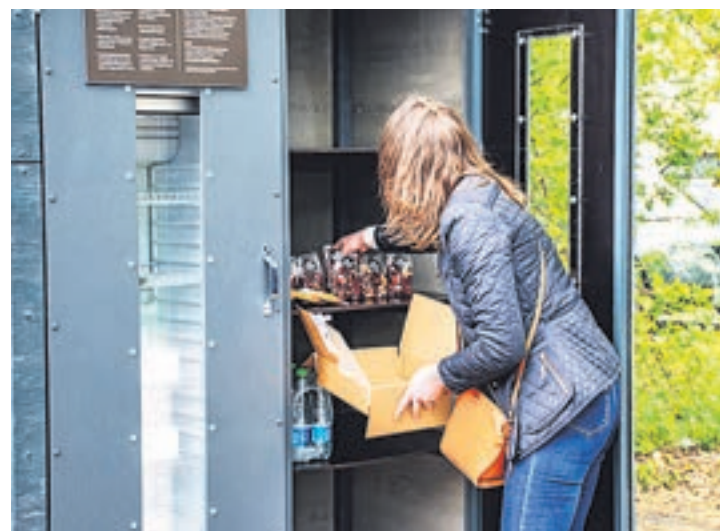
Haapsalu toidukapi avamisel oli seal ka toitu.

Aljaste lootis, et peagi leitakse mõni kohvik, kes toidukappi igapäevaselt täitma hakkab. Ta