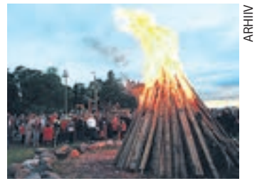
Jaanituli Aafrika rannas.

Kuuskmani sõnul on leedo- tuli olnud püha tuli, kus ei põle- tata vanu karpe ega suitsukoni- sid. Pööripäevaegsetest tegevus- test sõltub tema sõnul inimes-