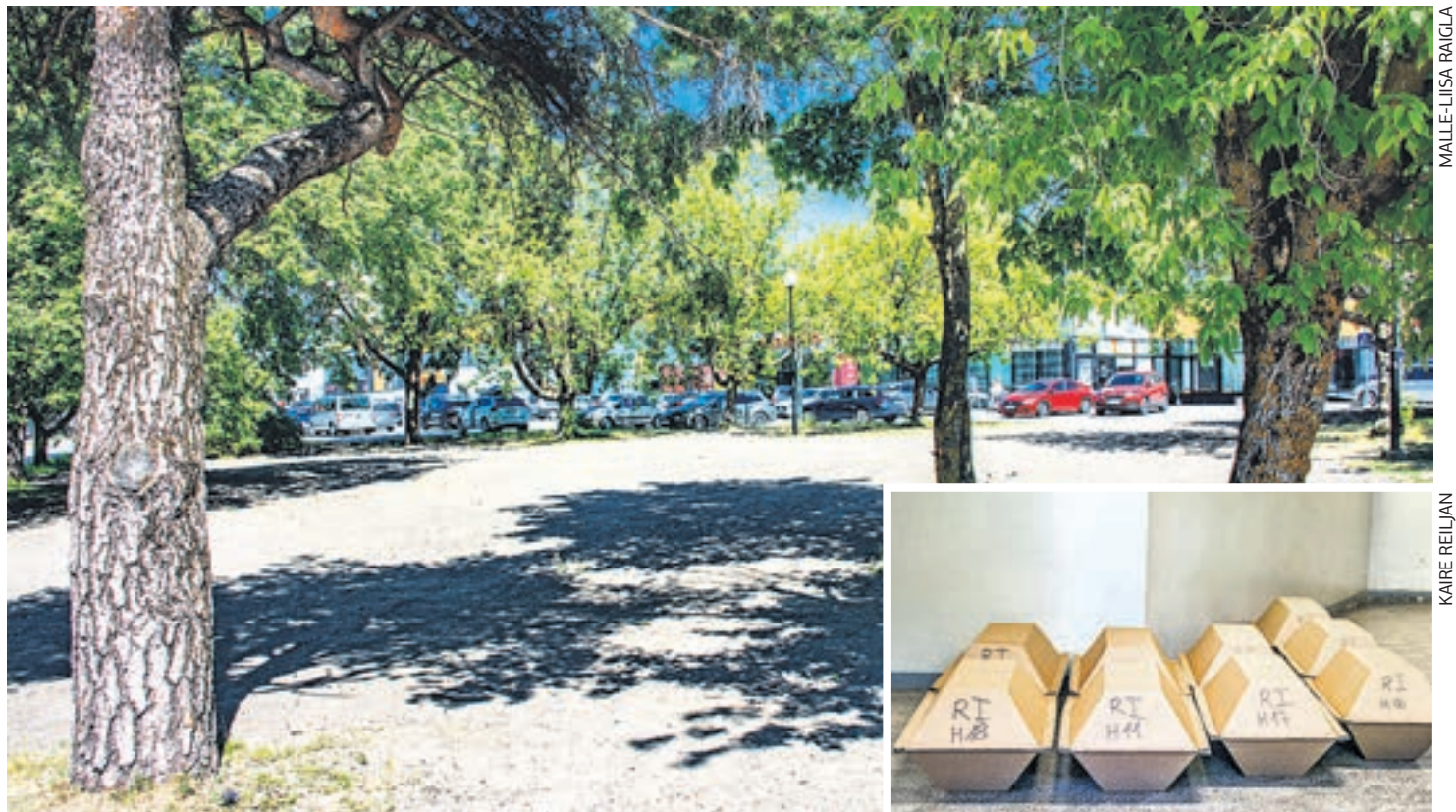
Haapsalu kesklinna asunud ühishaudade ala on korrastatud ja sinna muru külvatud. Välja kaevatud inimeste säilmed ootavad kirstudes ümbermatmist.