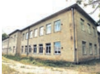
Kasari kool. URMAS LAURI

Sama pakkuja, kes ostis Kasari vana koolimaja, osales ka kooli spordiväljaku oksjonil, kuid loobus viimaks ja väljak läks teisele. 12 400 euroga oksjonile pandud 3,6 ha suuruse spordiplatsi lõpphinnaks jäi 14 201 eurot. Esmaspäeval leidis omaniku ka Kasari kooli võimla, mis läks müügiks alghinnaga 20 000 eurot.